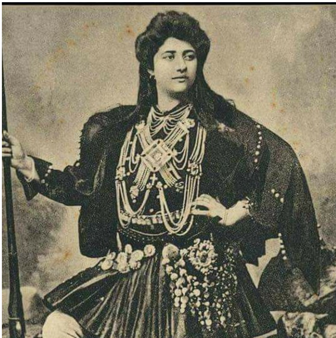
Η καπετάνισσα Περιστεέρα Κράκα.

Τα κατορθώματα του «Καπετάν Σπανοβαγγέλη» Η Περιστεέρα πολεμούσε με θάρρος για την ένωση με την ελεύθερη Ελλάδα. Ο Ι. Αποστόλου στην «Ιστορία τής Σιατίστης» έγραφε για εκείνη: «Επί εξ μήνας κατόπιν κανείς Τούρκος στρατιωτικός δεν ημπορούσε να κοιμάται ήσυχος. Απιστεύτως γενναία, η κόρη αυτή, προς την οποίαν επί τέλους ηναγκάσθη να συνθηκολογήσει μία ολόκληρος Αυτοκρατορία. Της έδωσαν αμνηστία...» Είχε το ψευδώνυμο «Καπετάν Σπανοβαγγέλης» και είχε ξεκινήσει κλεφτοπόλεμο με τους Τούρκους στις περιοχές της Κοζάνης και της Καστοριάς. Είχε κόψει τα μαλλιά της κοντά και σύμφωνα με τον Τύπο της εποχής, πολεμούσε σαν άντρας. Μεταξύ άλλων είχε πυρπολήσει τον σταθμό της χωροφυλακής Τζουμά Πτολεμαΐδος και είχε εξολοθρεύσει ένα τουρκικό απόσπασμα στα Καραγιάννινα. Η φήμη της είχε ξεπεράσει τα ελληνικά σύνορα και η γαλλική εφημερίδα «Λε Παπιγιόν» την αποκαλούσε Ζαν Ντ' Αρκ του 19ου αιώνα.