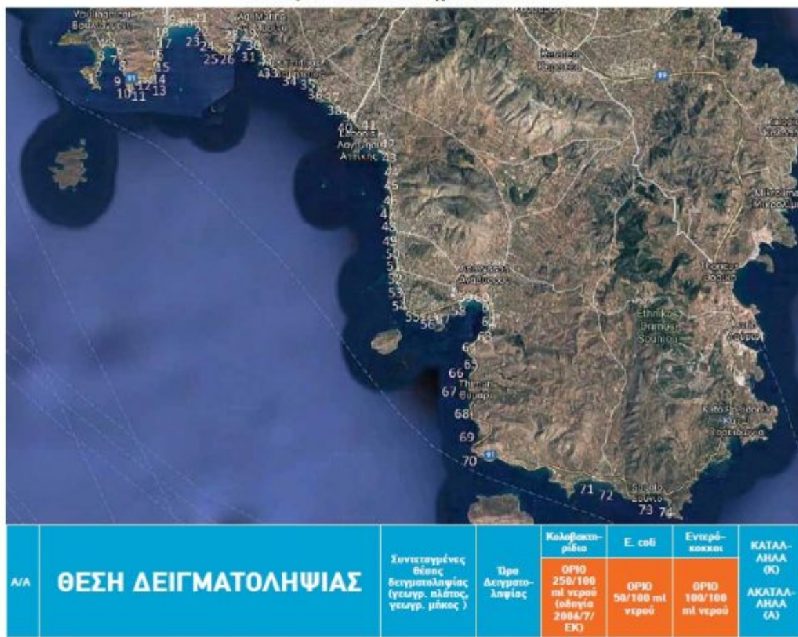
Πίνακας Αποτελεσμάτων μικροβιολογικών αναλύσεων σε δείγματα νερών κοθύμβησης στις παραλίες από Βουθιαγμένη έως Σούνιο