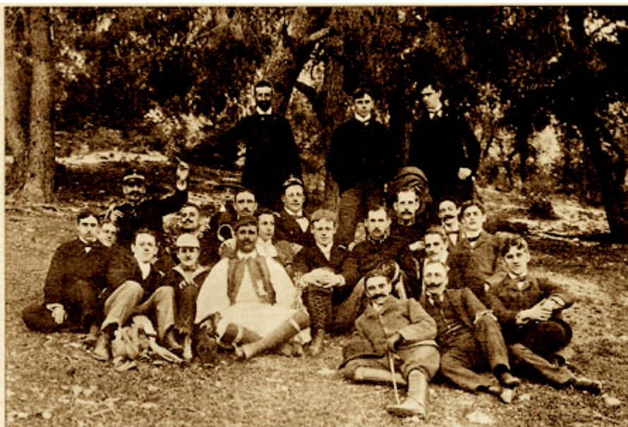
Ομάδα Ελλήνων αθλητών των Ολυμπιακών Αγώνων του 1896, σε τιμητική