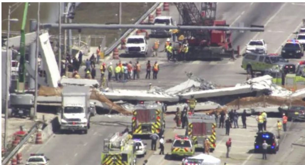
In this frame from video, emergency personnel work at the scene of a collapsed bridge in the Miami area, Thursday, March 15, 2018.

«Μπορεί να ευθύνονται τα υλικά, μπορεί να ευθύνεται η μέθοδος κατασκευής ή ακόμη κι ο σχεδιασμός της», είπε ο πρώην πρόεδρος της Αμερικανικής Ένωσης Πολιτικών Μηχανικών, Άντι Χέρμαν.