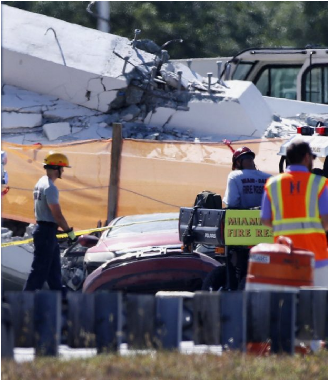
A rescue worker walks near a car crushed in the rubble after a brand-new pedestrian bridge collapsed onto a highway at Florida International University in Miami on Thursday, March 15, 2018. The pedestrian bridge collapsed onto a highway crushing multiple vehicles and killing several people.