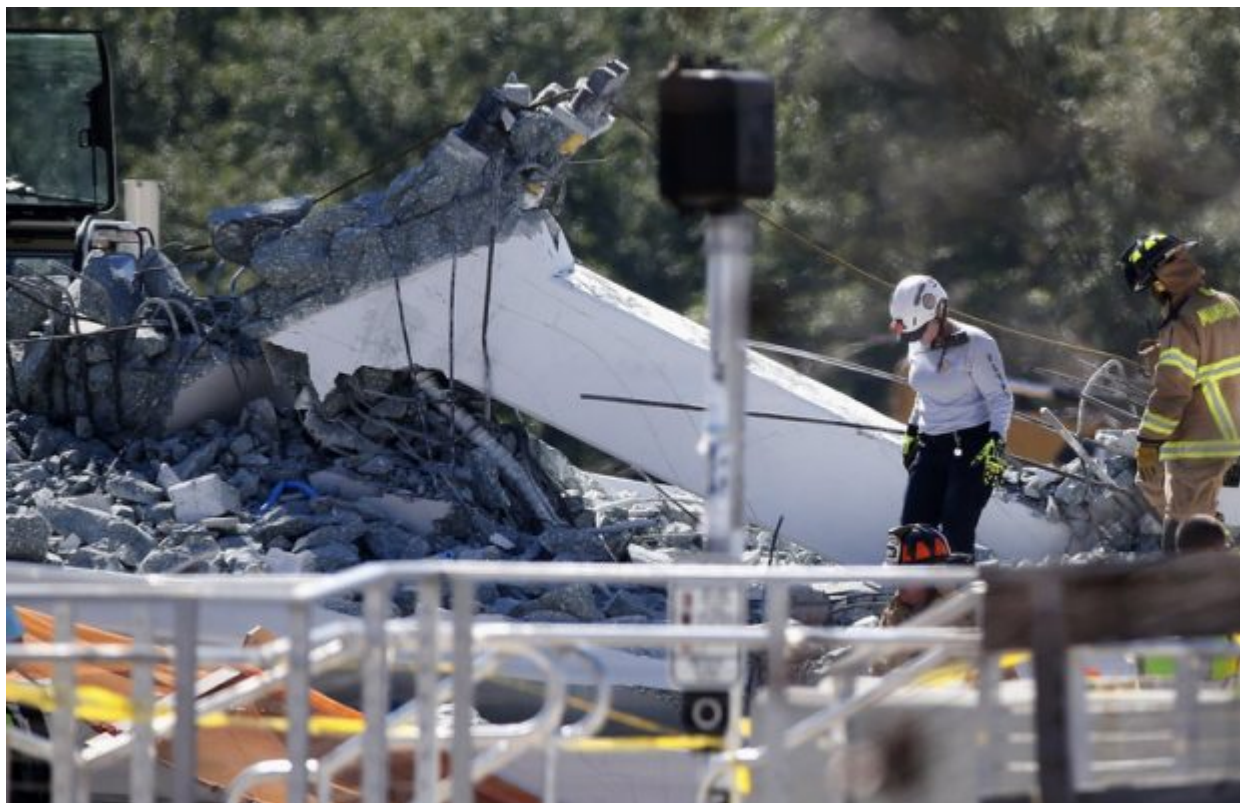
Rescue workers walk on the rubble after a brand-new pedestrian bridge collapsed at Florida International University in Miami on Thursday, March 15, 2018. The pedestrian bridge collapsed onto a highway crushing multiple vehicles and killing several people.

Η πεζογέφυρα συνέδεε τους κοιτώνες του πανεπιστημίου με την πόλη Σουίτγουότερ. Είχε μήκος 53 μέτρα και ζύγιζε 950 τόνους. Δεν είχε ανοίξει ακόμη για το κοινό. Οι φοιτητές του Διεθνούς Πανεπιστημίου αυτήν την περίοδο έχουν διακοπές από τα μαθήματά τους, από τις 12 μέχρι τις 17 Μαρτίου.