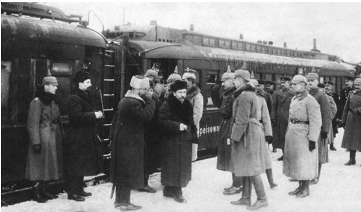
Γερμανικό άγημα υποδέχεται τη σοβιετική αποστολή (Κάμενεφ, Τρότσκι) στο σταθμό του Μπρεστ-Λιτόφσκ

Στις 3 Μαρτίου του 1918 υπεγράφη το τρίτο μέρος της Συνθήκης του Μπρεστ-