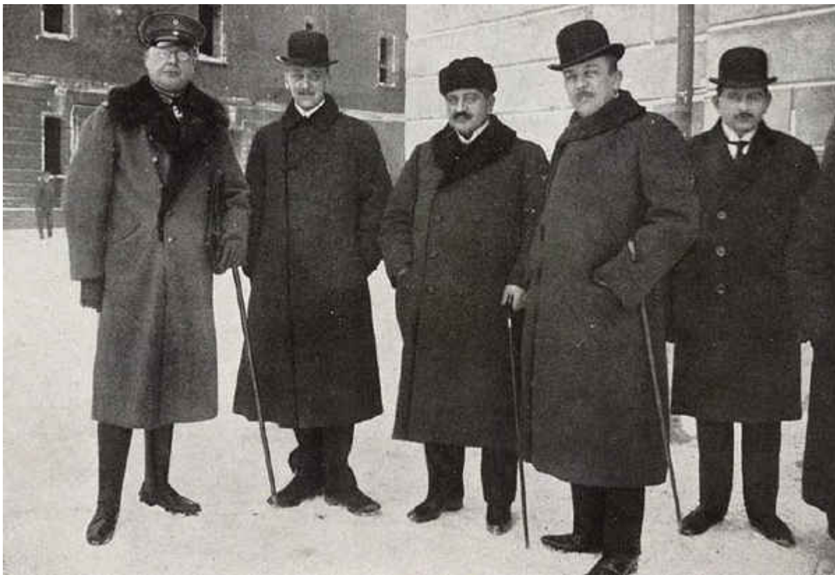
Αντιπρόσωποι των Κεντρικών Δυνάμεων: ο Γερμανός στρατηγός Χόφμαν, ο υπ. Εξωτερικών της Αυστροουγγαρίας κόμης Τσέρνιν, ο εκπρόσωπος των Οθωμανών Μεχμέτ Ταλαάτ πασάς και ο Γερμανός υπ.Εξωτερικών φον Κούλμαν

Με την επικράτηση των Μπολσεβίκων στην εξουσία στις 25 Οκτωβρίου (7 Νοεμβρίου) του 1917, η Ρωσία εξήλθε από την Αντάντ. Οι Γερμανοί, ενώ ηττήθηκαν από τις Δυνάμεις υπό την ηγεσία της Αγγλίας, της Γαλλίας και της Ρωσίας, έβλεπαν την αδυναμία σκληρής διαπραγμάτευσης εκ μέρους της νέας ρωσικής ηγεσίας.