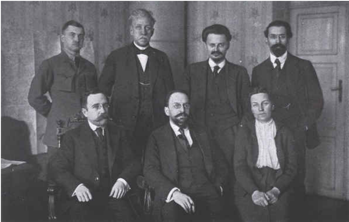
Η σοβιετική αντιπροσωπεία: α΄ σειρά Κάμενεφ, Γίοφε, Μπιτσένκο· β΄ σειρά Λίπσκι, Στούτσκα, Τρότσκι, Κάραχαν

διαπραγματευτούν, οι εκπρόσωποι της σοβιετικής εξουσίας υπέγραψαν την παραχώρηση εδαφών άνευ όρων. Η Ρωσία παρέδιδε στις Κεντρικές Δυνάμεις την Πολωνία και τη Λιθουανία. Η Λετονία, η Εσθονία και η Φινλανδία εκκενώνονταν από τα ρωσικά στρατεύματα.