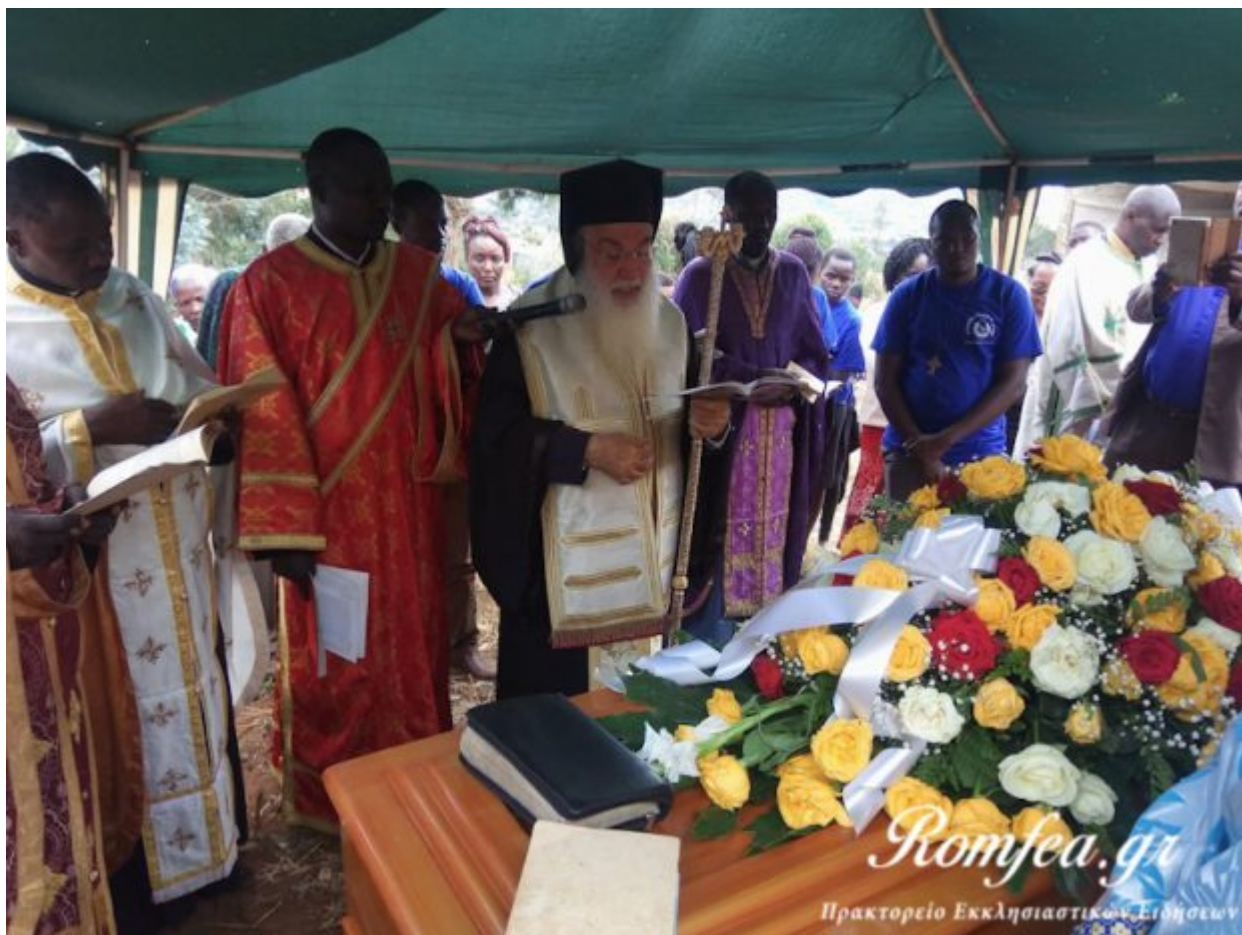
Του Μητροπολίτη Ναϊρόμπης κ. Μακαρίου

Μέσα στον χώρο της ιεραποστολής συνήθως παρουσιάζουμε στο ευρύ κοινό είτε διά του γραπτού λόγου είτε μέσω της τηλεόρασης και την εποχή μας από το διαδίκτυο όλα τα τεκταινόμενα για να ενισχύσουμε τους ανθρώπους που μας βοηθούν και συμπαρίστανται στο έργο μας.