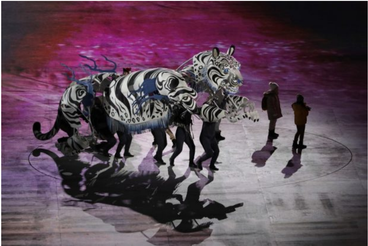
Dancers perform during the opening ceremony of the 2018 Winter Olympics in Pyeongchang, South Korea, Friday, Feb. 9, 2018.