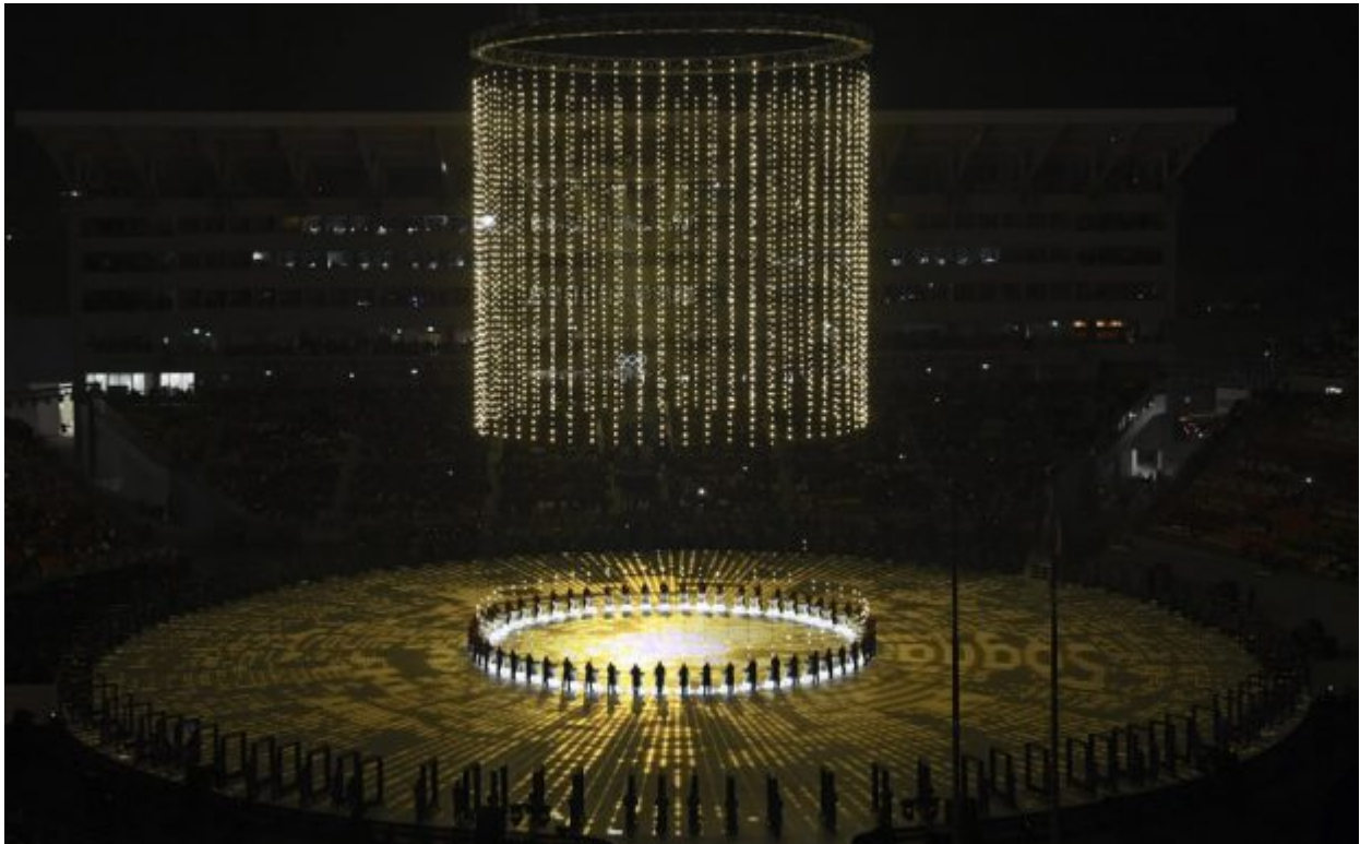
Performers participate during the opening ceremony of the 2018 Winter Olympics in Pyeongchang, South Korea, Friday, Feb. 9, 2018.