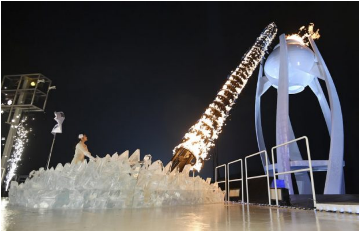
South Korean Olympic figure skating champion Yuna Kim lights the Olympic flame during the opening ceremony of the 2018 Winter Olympics in Pyeongchang, South Korea, Friday, Feb. 9, 2018.