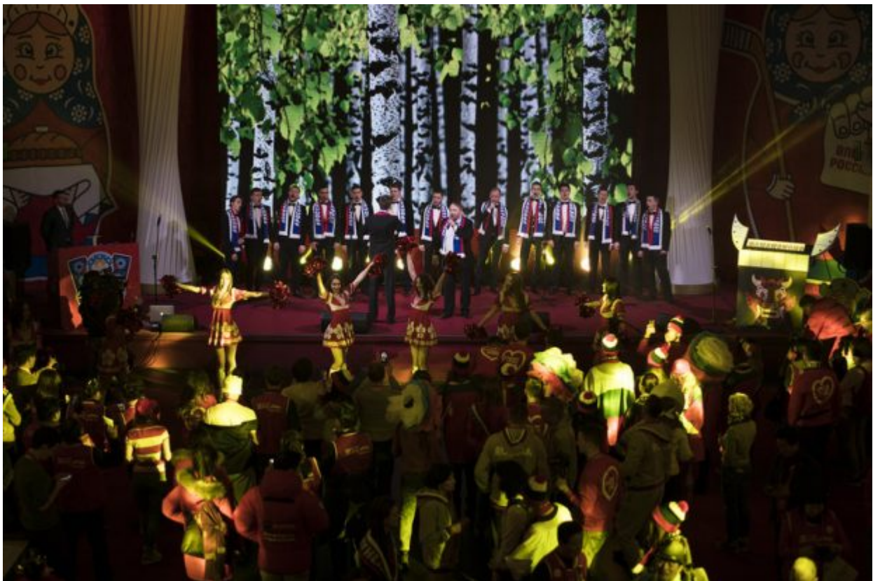
Russian singers and cheerleaders perform during the opening of the Sports House, set up to support the Russian delegation of the 2018 Winter Olympics, in Gangneung, South Korea, Friday, Feb. 9, 2018.