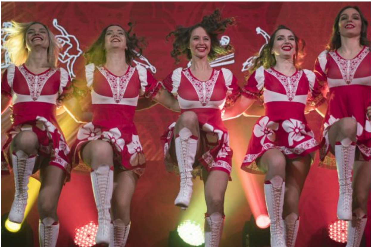
Russian cheerleaders perform during the opening of the Sports House, set up to support the Russian delegation of the 2018 Winter Olympics, in Gangneung, South Korea, Friday, Feb. 9, 2018.