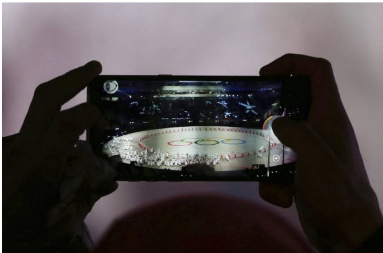
A spectator takes a picture of the opening ceremony of the 2018 Winter Olympics in Pyeongchang, South Korea, Friday, Feb. 9, 2018.