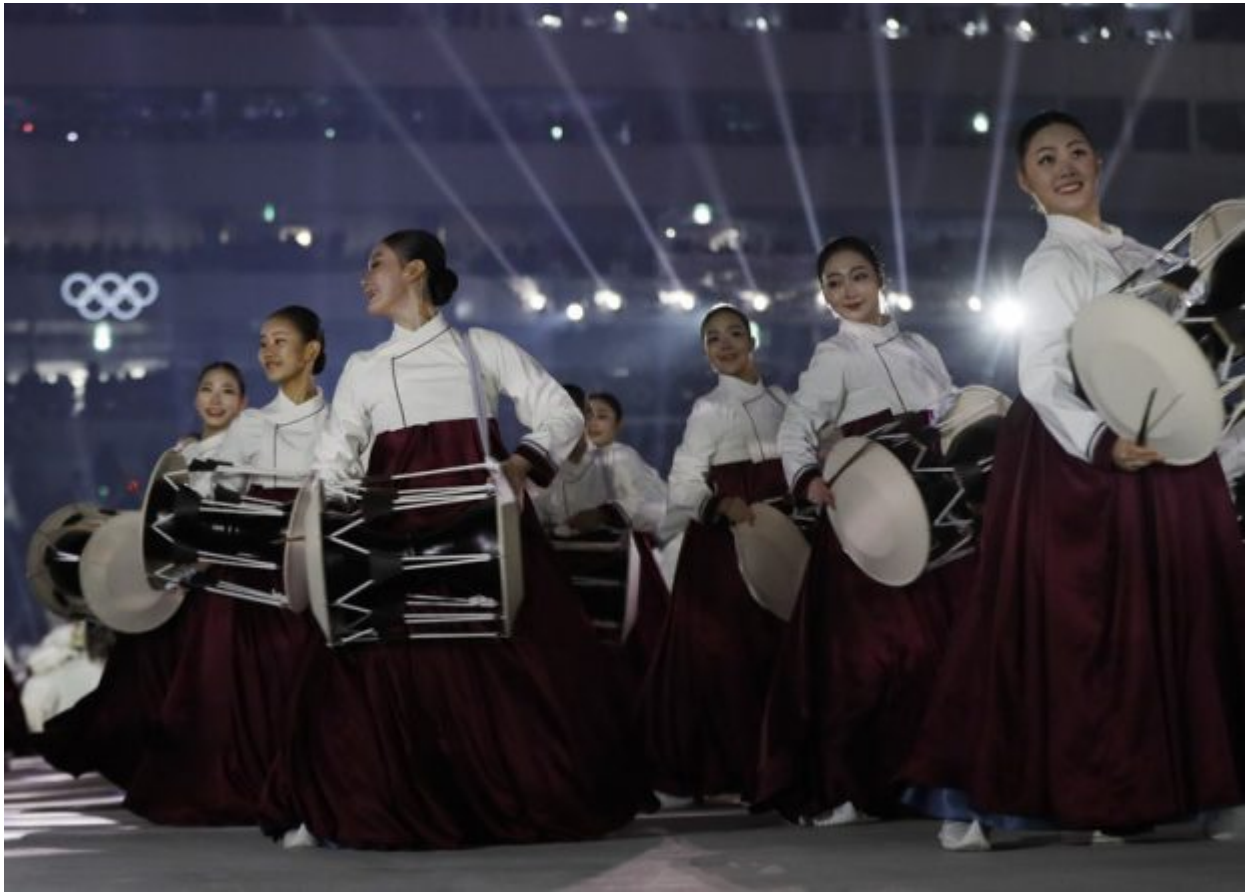
Performers participate during the opening ceremony of the 2018 Winter Olympics in Pyeongchang, South Korea, Friday, Feb. 9, 2018.