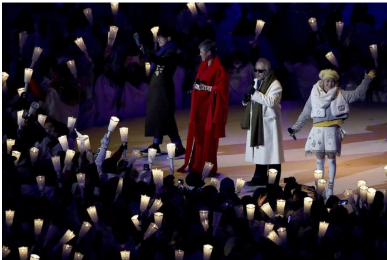
From left; Singers Ha Hyun-woo, Lee Eun-mi, Jeon In-kwon and An Ji-yeong perform during the opening ceremony of the 2018 Winter Olympics in Pyeongchang, South Korea, Friday, Feb. 9, 2018.

Την τελετή έναρξης σημάδεψαν με την παρουσία του Ρώσοι τραγουδιστές και τσιρλίντες, τοπικά συγκροτήματα, παραδοσιακά όργανα και καλλιτέχνες.