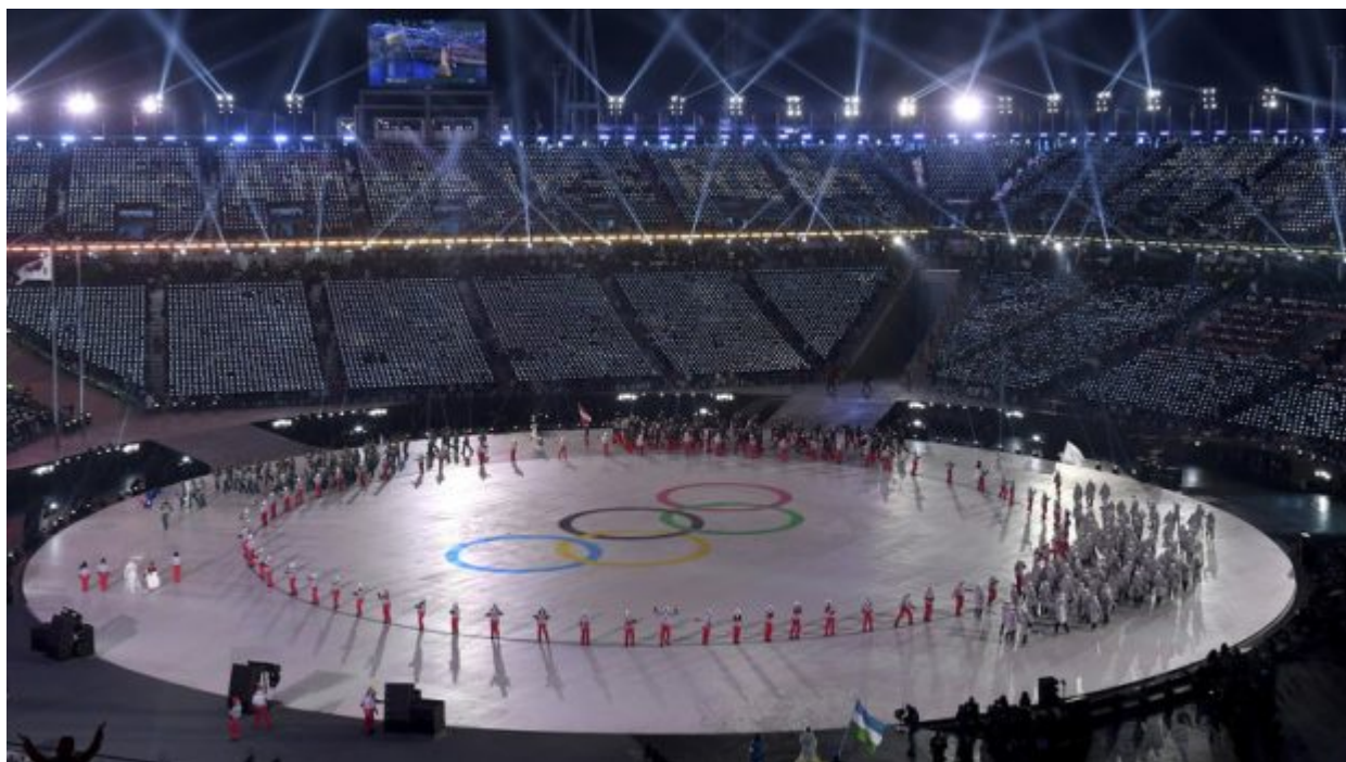
Athletes of Russia arrive during the opening ceremony of the 2018 Winter Olympics in Pyeongchang, South Korea, Friday, Feb. 9, 2018.

Πόσο κοστίζουν τελικά οι Χειμερινοί Ολυμπιακοί Αγώνες;