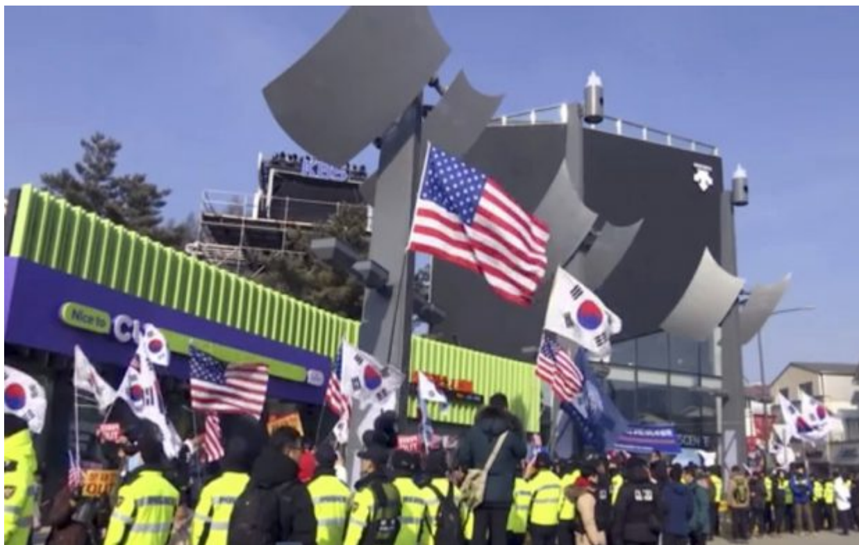
In this grab taken from TV, protesters hold flags as they demonstrate outside the Olympic Stadium in Pyeongchang, South Korea, Friday, Feb. 9, 2018. Around 50 people protested on Friday against North Korea's participation in the Winter Olympics, ahead of the opening ceremony for the Games in Pyeongchang.