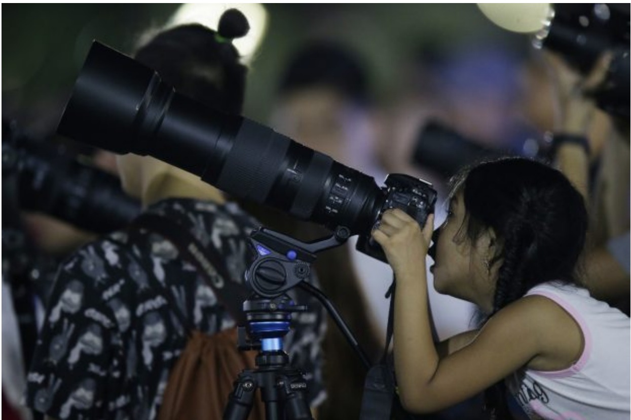
A girl peeks inside the viewfinder of a camera to see a lunar eclipse at a park in Manila, Philippines on Wednesday, Jan. 31, 2018. On Wednesday, much of the world will get to see not only a blue moon