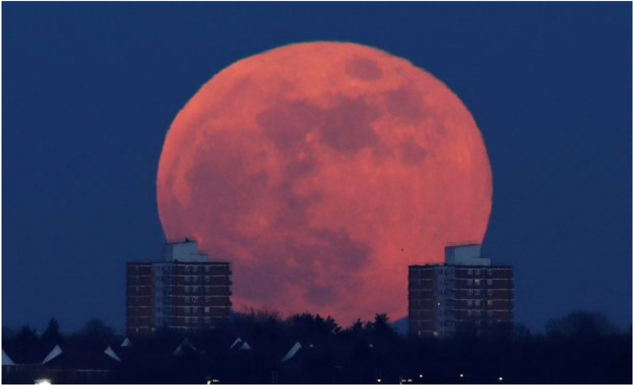
A full moon rises behind blocks of flats in north London, Britain, January 31, 2018. REUTERS/Eddie Keogh TPX IMAGES OF THE DAY