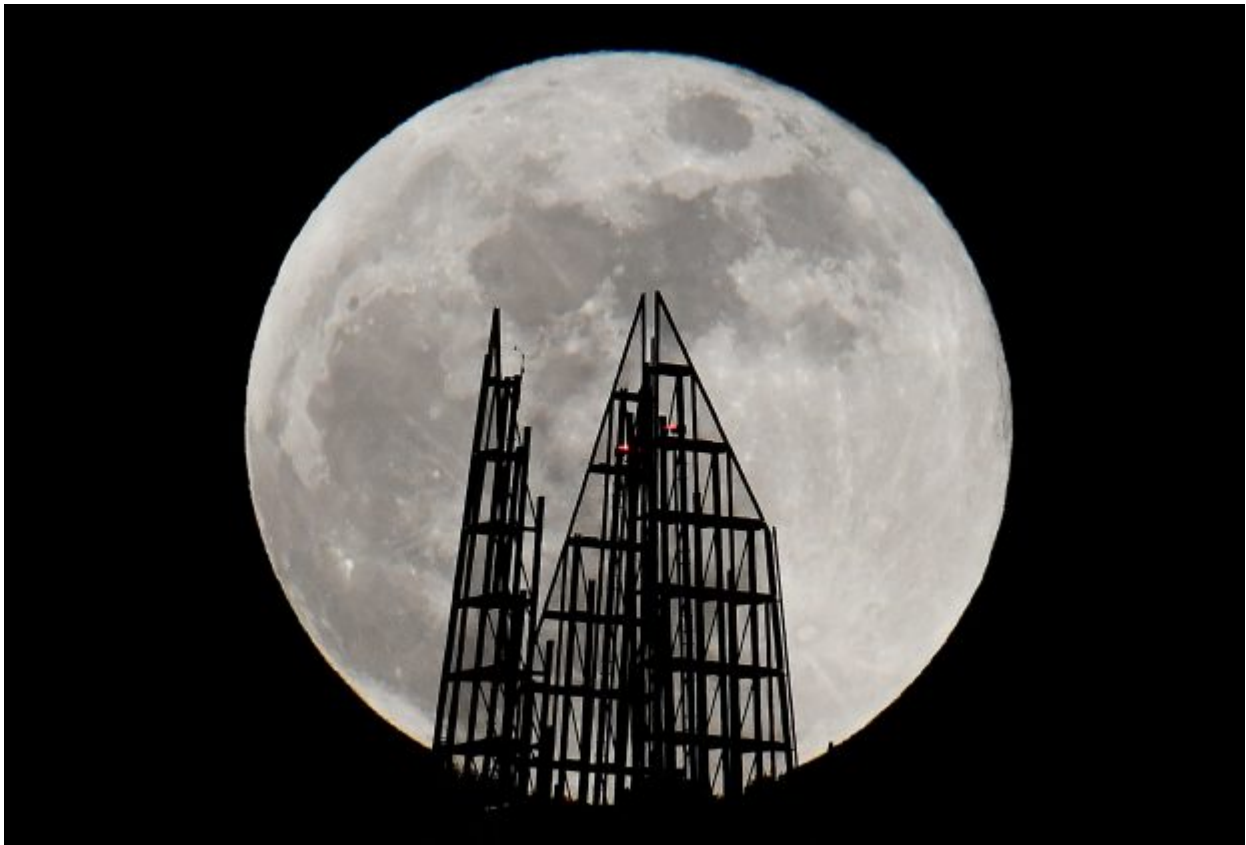
A supermoon full moon is seen behind the Shard skyscraper in London, Britain January 31, 2018.