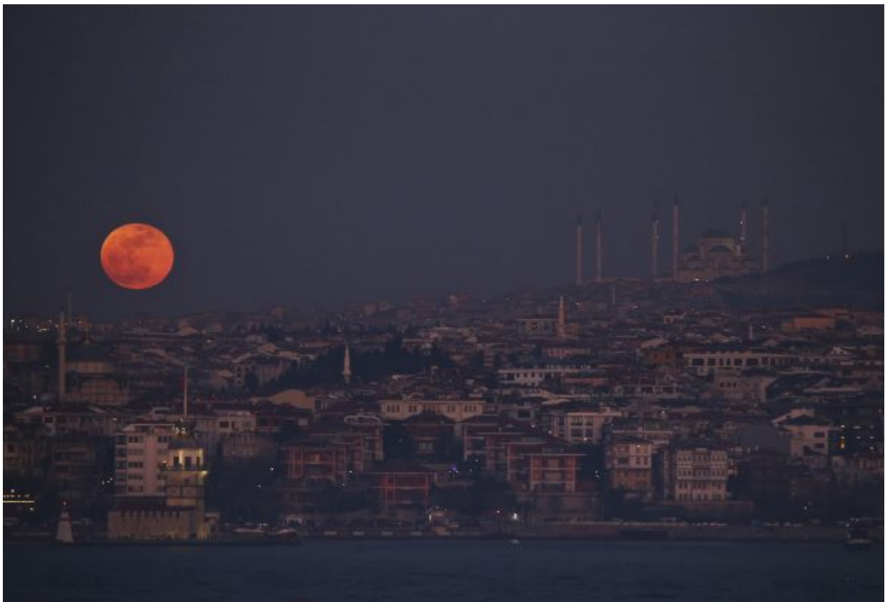
With the Bosporus Strait separating Europe and Asia in the foreground, and the Camlica Mosque, top