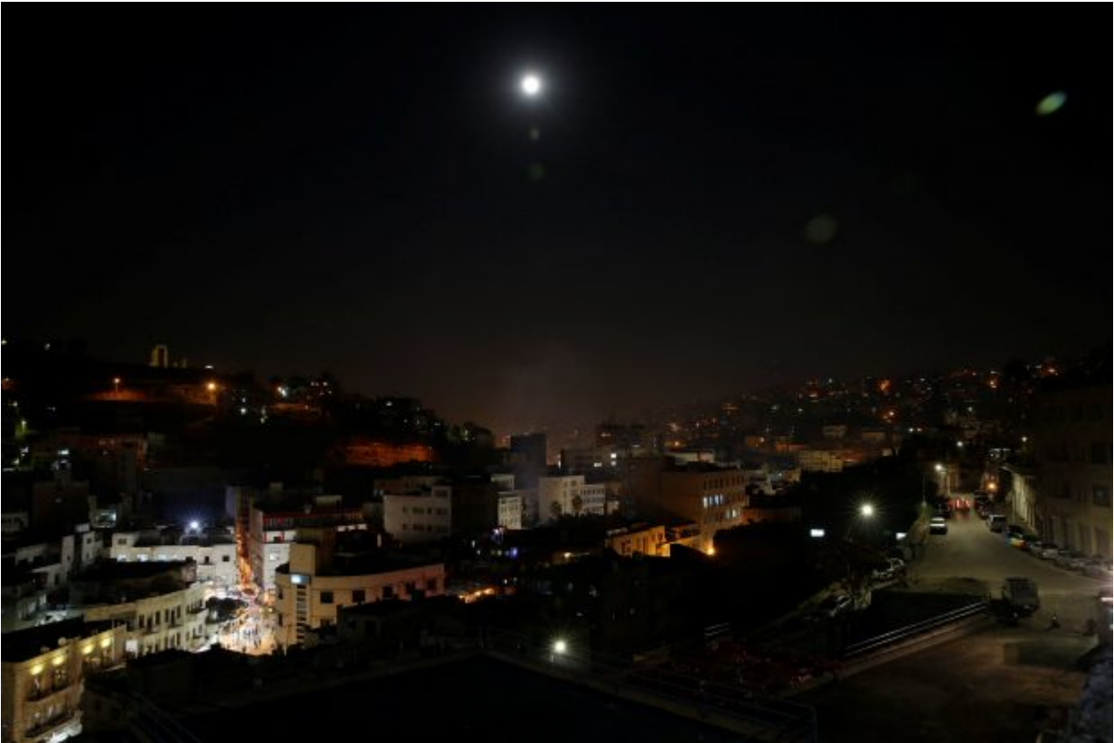
A super blue blood moon rise is seen in the sky of Jordanian capital Amman, January 31, 2018.