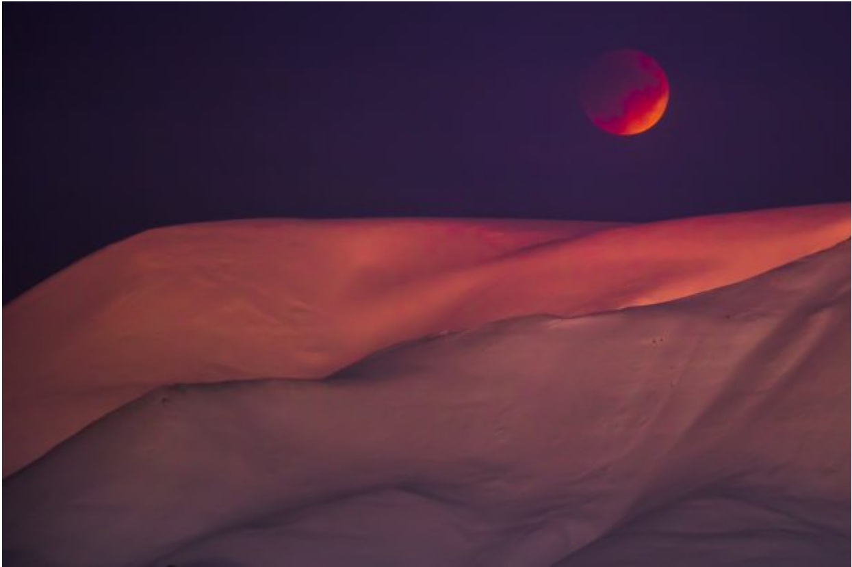
epa06488718 A super blue blood moon is seen from Longyearbyen, Svalbard, Norway, 31 January 2018, during the last time in a series of three consecutive 'Supermoons', dubbed the 'Supermoon Trilogy'. The previous 'Supermoons' appeared on 03 December 2017 and on 01 January 2018. A 'Supermoon' commonly is described as a full moon at its closest distance to the earth with the moon appearing larger and brighter than usual.