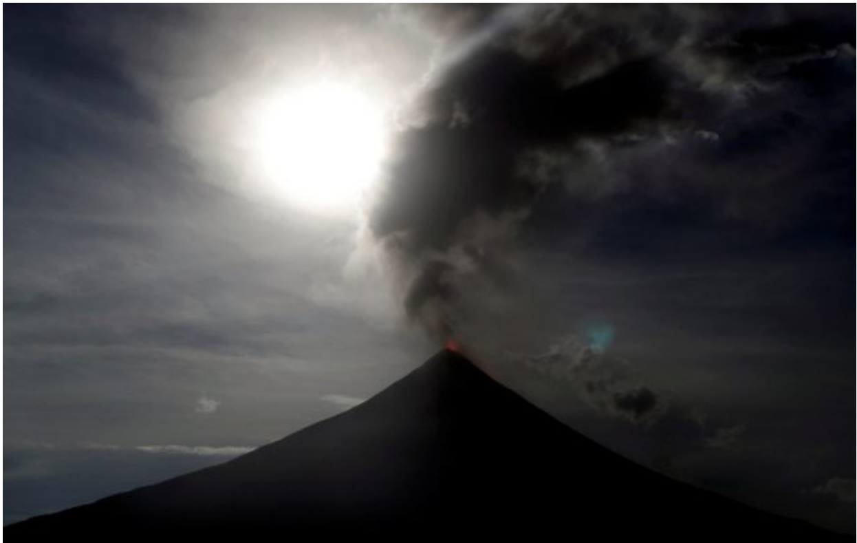
The super blue moon rises above the spewing Mayon Volcano during a mild eruption before a total lunar eclipse in Legazpi, Philippines, January 31, 2018. REUTERS/Erik De Castro TPX IMAGES OF THE DAY