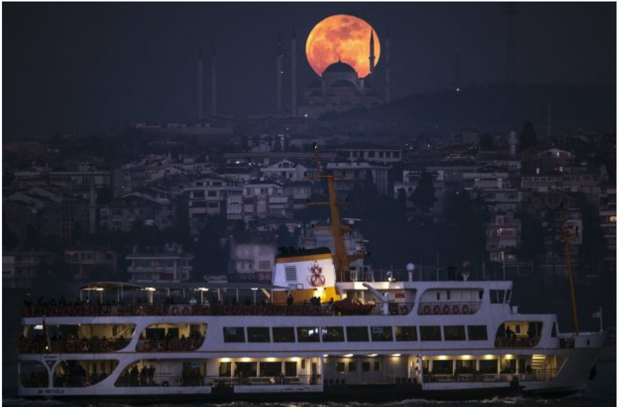
epa06488550 A so-called 'Supermoon' rises above the Camlica Mosque in Istanbul, Turkey, 31 January 2018, during the last time in a series of three consecutive 'Supermoons', dubbed the 'Supermoon TrilogY'. The previous 'Supermoons' appeared on 03 December 2017 and on 01 January 2018. A 'Supermoon' commonly is described as a full moon at its closest distance to the earth with the moon appearing larger and brighter than usual.

full moon at its closest distance to the earth with the moon appearing larger than usual.