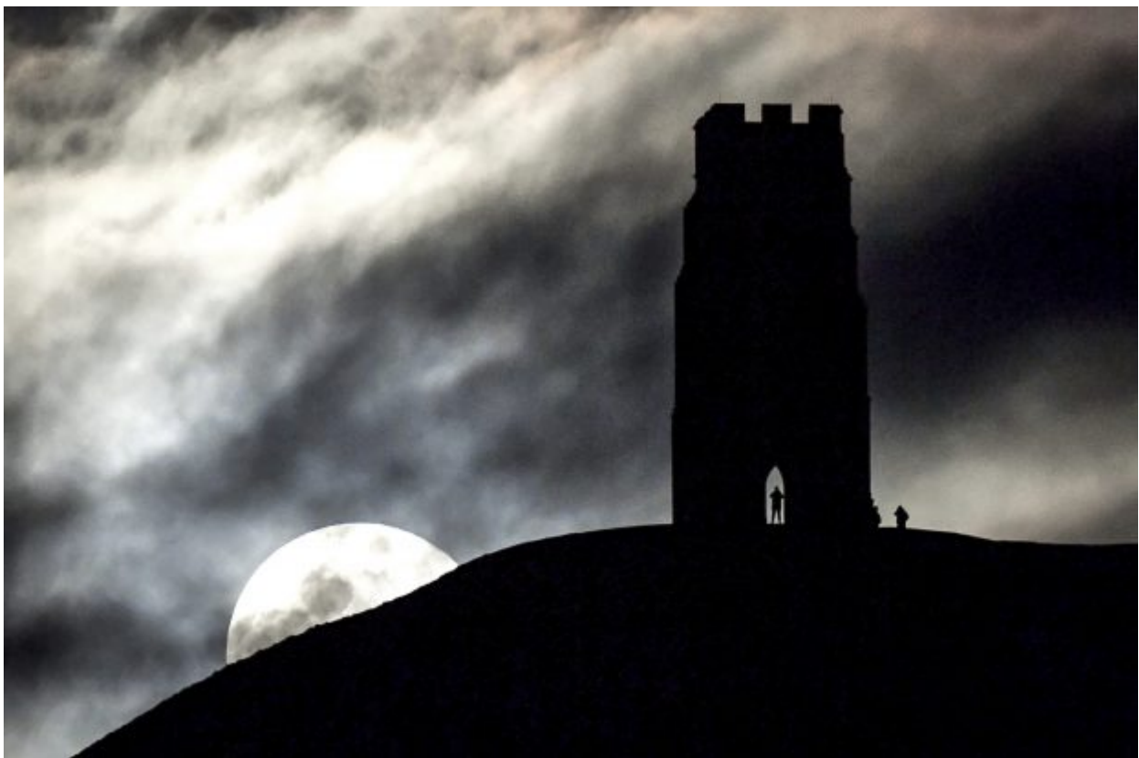
The moon rises behind Glastonbury Tor, southwestern England, Wednesday Jan. 31, 2018. On