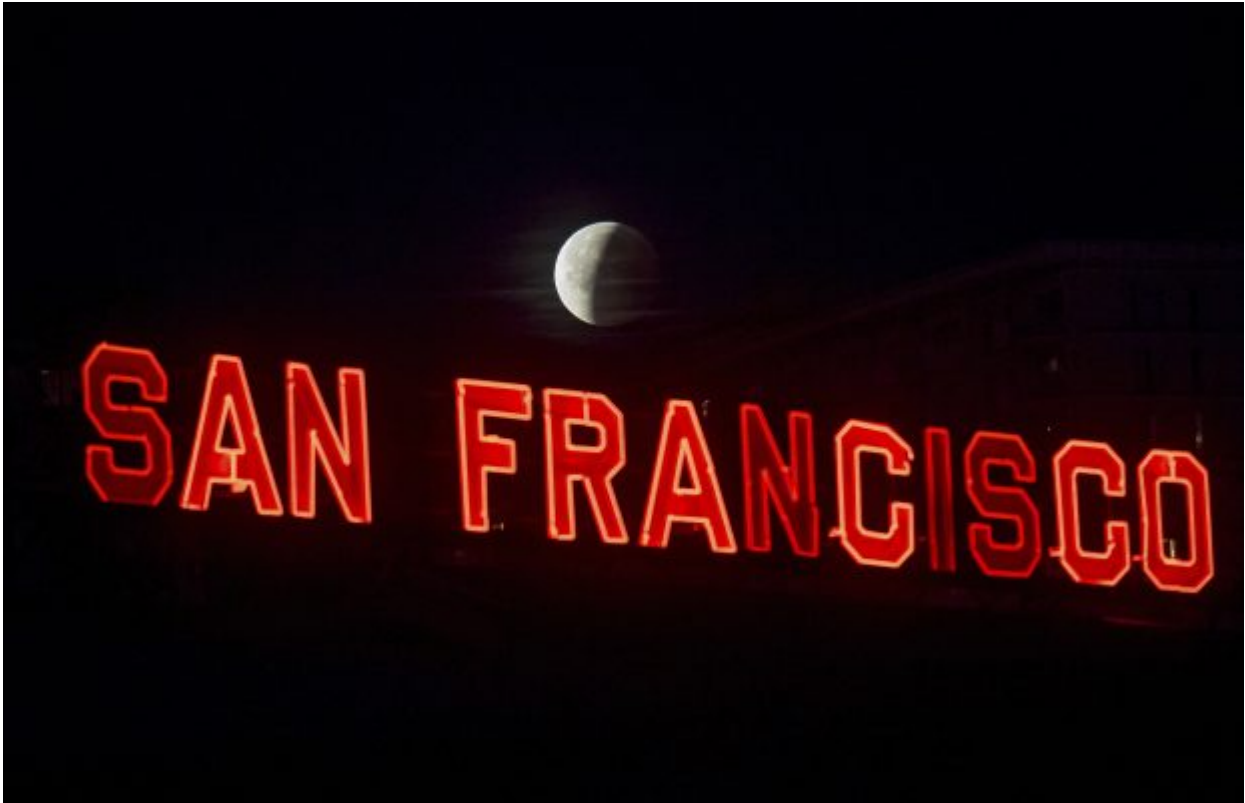
A partially-eclipsed super blue blood moon sets behind a sign at San Francisco's Ferry Building on Wednesday, Jan. 31, 2018. It's the first time in 35 years a blue moon has synced up with a supermoon and a total lunar eclipse, also called a blood moon because of its red hue.

eclipse was visible in the East Coast.