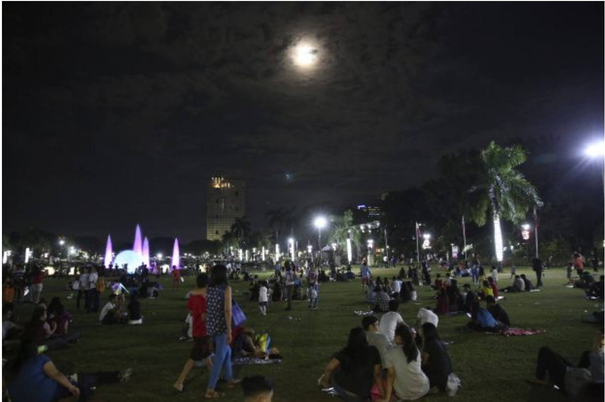
Filipinos watch a lunar eclipse at a park in Manila, Philippines on Wednesday, Jan. 31, 2018. On Wednesday, much of the world will get to see not only a blue moon which is a supermoon, but also a lunar eclipse, all rolled into one celestial phenomenon.

celestial phenomenon. At left is the London Eye and at right The Shard.