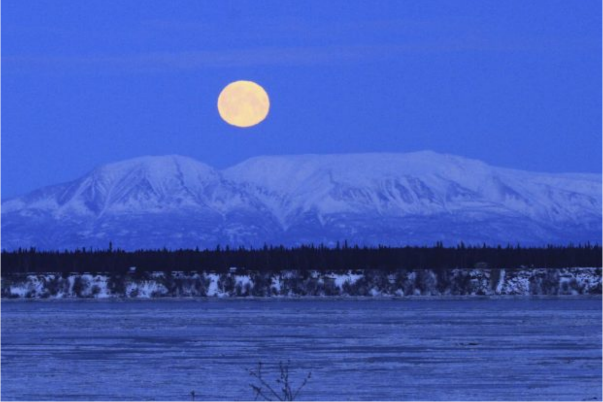
The moon sets over Mount Susitna, known locally as Sleeping Lady, across Cook Inlet on Wednesday, Jan. 31, in Anchorage, Alaska.