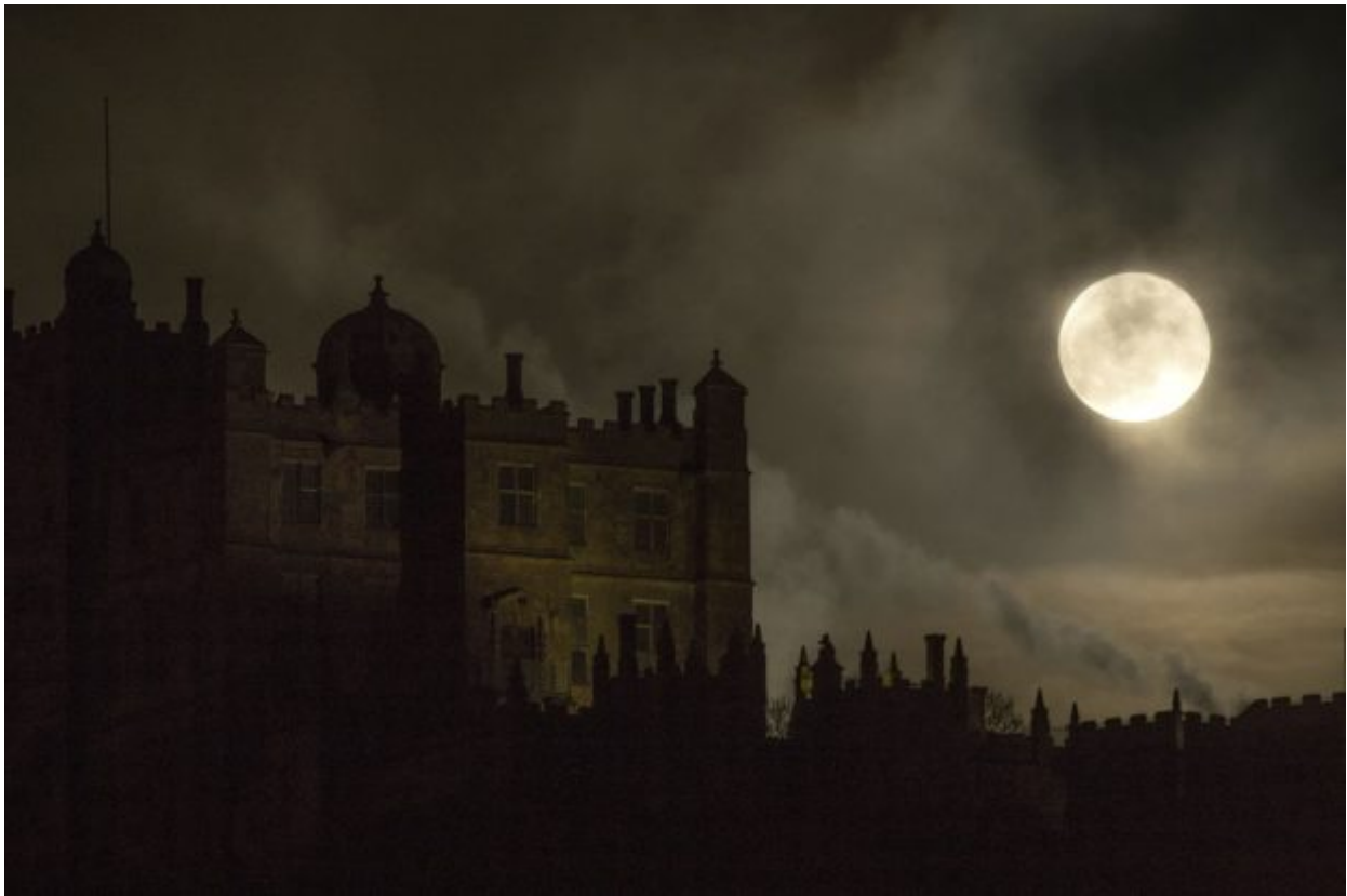
The moon rises over Bolsover Castle northwest England, Wednesday Jan. 31, 2018. On Wednesday, much of the world will get to see not only a blue moon which is a supermoon, but also a lunar eclipse, all rolled into one celestial phenomenon. Earth's natural satellite appears about 14% bigger and 30% brighter in the sky as it reaches its closest point to Earth.