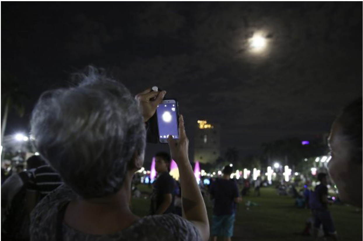
A woman records a lunar eclipse at a park in Manila, Philippines on Wednesday, Jan. 31, 2018. On Wednesday, much of the world will get to see not only a blue moon which is a supermoon, but also a lunar eclipse, all rolled into one celestial phenomenon.