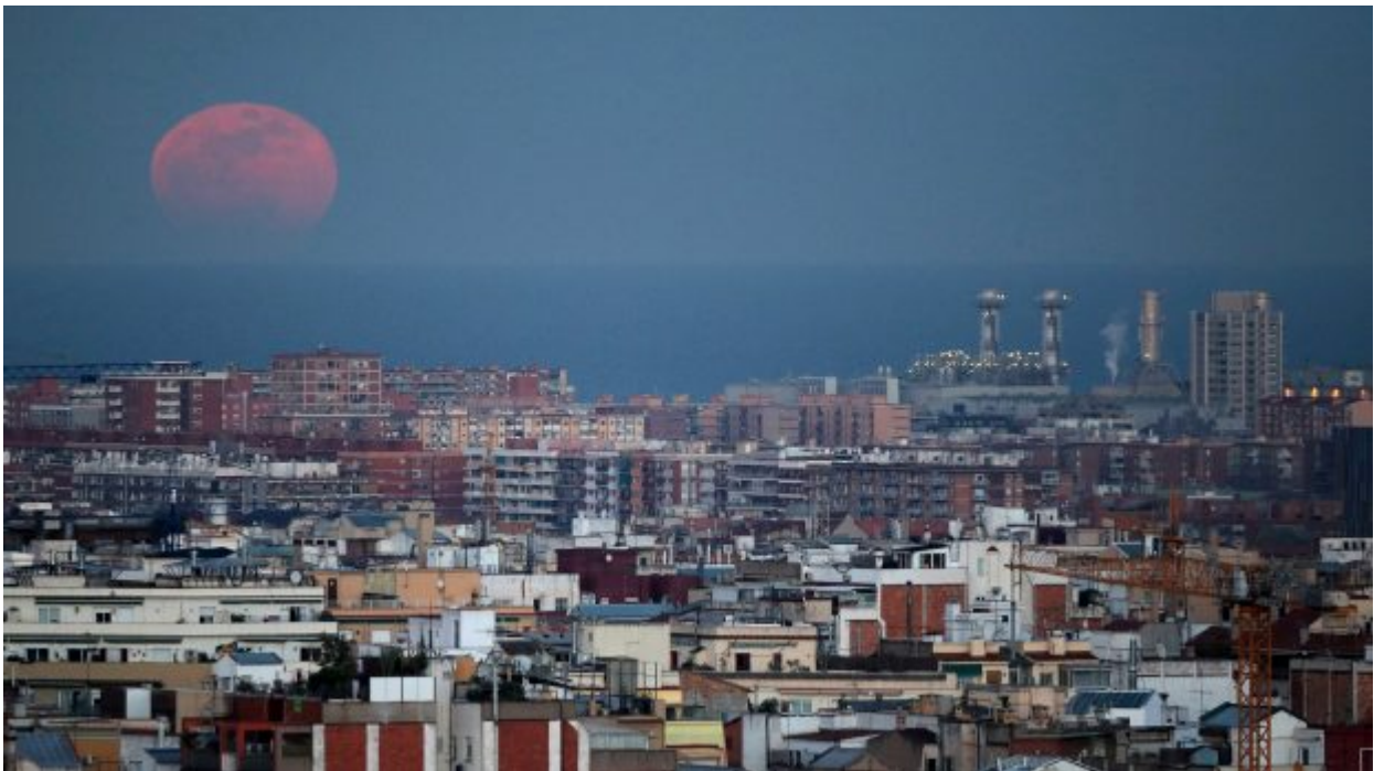
A full moon "Super Blue Blood Moon" rises behind Mediterranean sea in Barcelona, Spain January 31, 2018.