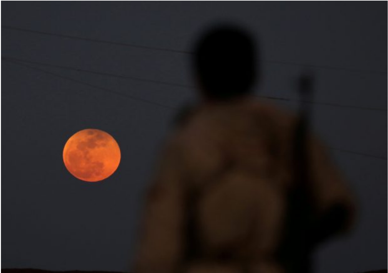
A fighter from Free Syrian Army is seen watching a full moon rises in Daraa, Syria January 31, 2018. REUTERS/ Alaa al-Faqir TPX IMAGES OF THE DAY