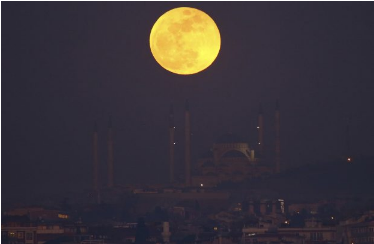
A super blue blood moon rises over Istanbul, behind the Camlica Mosque, the largest mosque in Asia Minor, Wednesday, Jan. 31, 2018. It's the first time in 35 years a blue moon has synced up with a supermoon and a total lunar eclipse, or blood moon because of its red hue, all rolled into one celestial phenomenon.