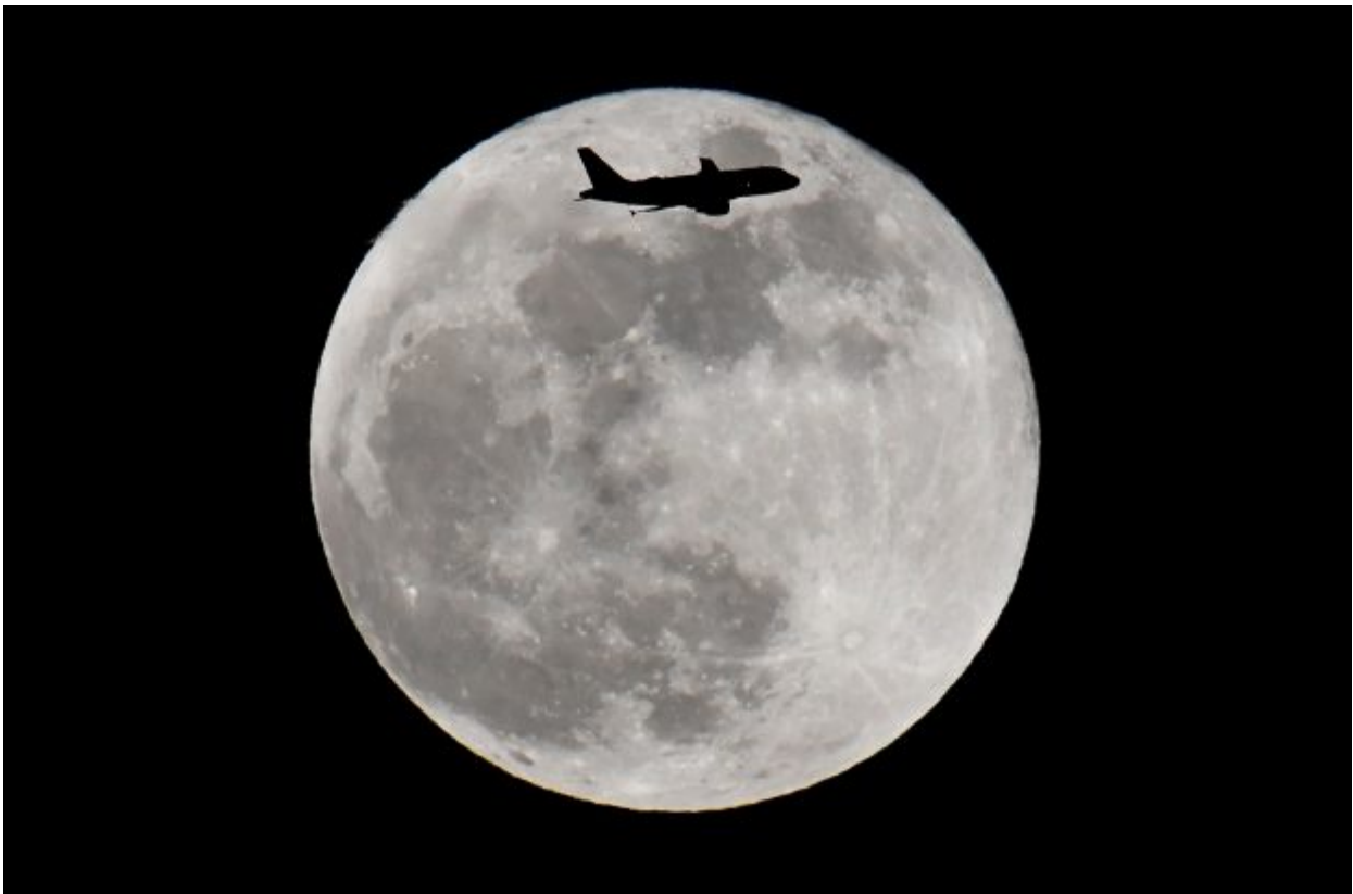
A passenger plane flies in front of a supermoon full moon over London, Britain, January 31, 2018.