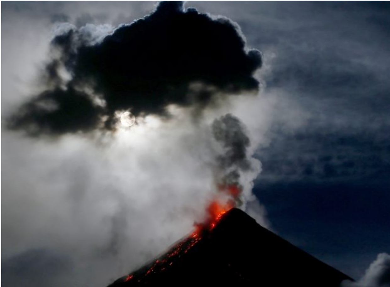
The super blue blood moon, seen through volcanic ash cloud, sets before dawn as lava cascades down the slopes of Mayon volcano during a sporadic mild eruption as seen from Sto. Domingo township, Albay province around 340 kilometers (200 miles) southeast of Manila, Philippines Thursday, Feb. 1, 2018. It's the first time in 35 years a blue moon has synced up with a supermoon and a total lunar eclipse, or blood moon because of its red hue.

Δείτε εικόνες από όλο τον κόσμο που «μαγεύτηκε» από τη δύναμη του σύμπαντος.