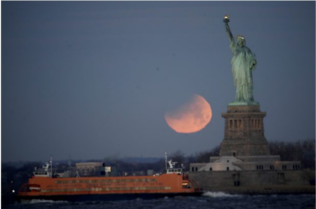
The Statue of Liberty and the Staten Island Ferry are backdropped by a supermoon, Wednesday, Jan. 31, 2018, seen from the Brooklyn borough of New York. The supermoon, which is the final of three consecutive supermoons, also experience lunar eclipse as it set over the horizon, but only a partial