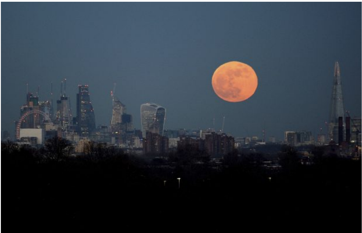
The moon rises over the London skyline, Wednesday Jan. 31, 2018. On Wednesday, much of the world will get to see not only a blue moon which is a supermoon, but also a lunar eclipse, all rolled into one