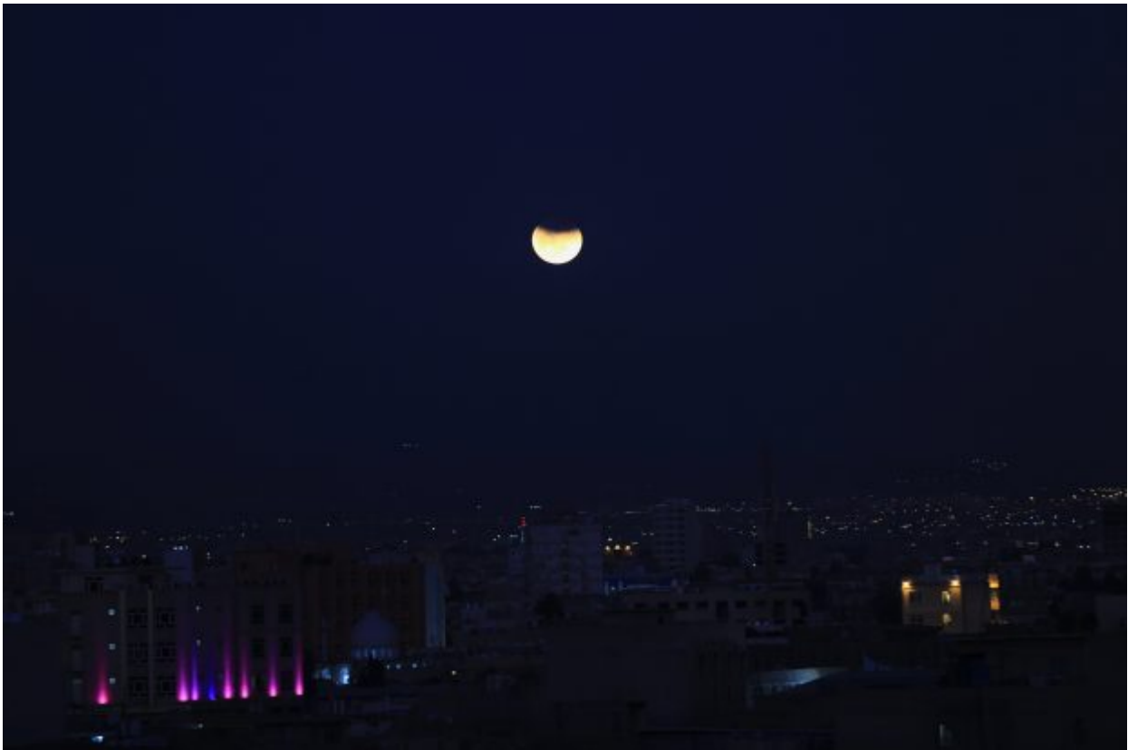
epa06488552 The supermoon passes out of the earth's shadow during a lunar eclipse as a super blue blood moon sets over the downtown Erbil City, Kurdistan Region, Iraq, 31 January 2018. The previous 'Supermoons' appeared on 03 December 2017 and on 01 January 2018. A 'Supermoon' commonly is a