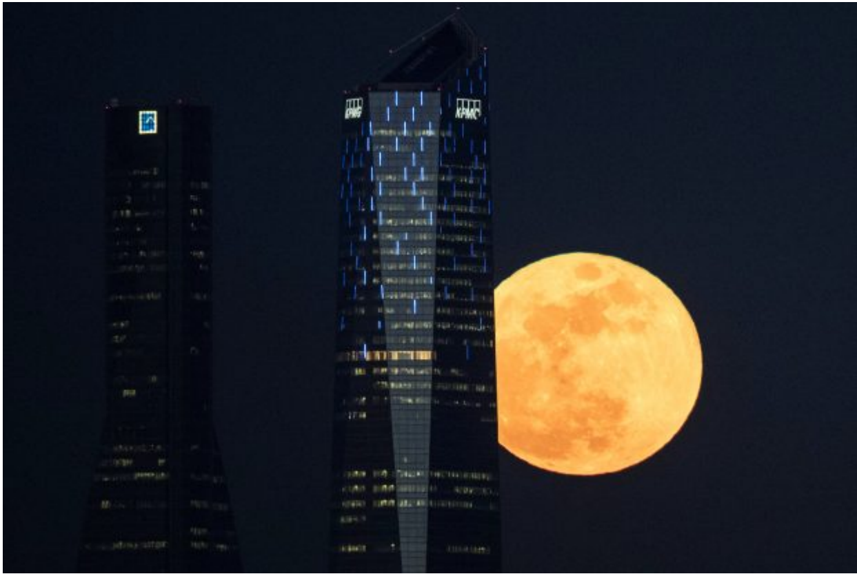
A full moon "supermoon" rises between skyscrapers in Madrid, Spain, January 31, 2018.

right, the largest mosque in Asia Minor, as the supermoon rises over Istanbul, Wednesday, Jan. 31, 2018. On Wednesday, much of the world will get to see not only a blue moon which is a supermoon, but also a lunar eclipse, turning the moon blood red, all rolled into one celestial phenomenon.