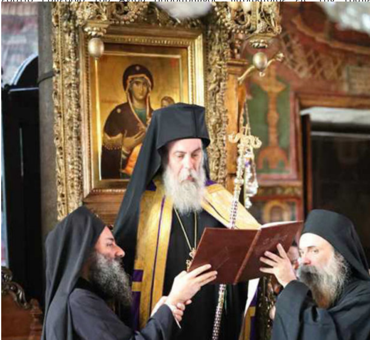
Μεγίστης Μεγίστης Μονής Κισάμου

Επίσης προσκύνησε το Άξιον Εστί στο Πρωτάτο, τις Ιερές Μονές: Ιβήρων, Παντοκράτορος και Καρακάλου, όπου και συναντήθηκε μετά των Καθηγουμένων: Γέροντος Ναθαναήλ, Γέροντος Γαβριήλ και Γέροντος Φιλοθέου αντίστοιχα, ως επίσης και την Ιερά Μονή Σίμωνος Πέτρας όπου και συμπροσευχήθηκε εις τον εόρτιο Εσπερινό του Αγίου Βησσαρίωνος παρακάθισε εις την τράπεζα και