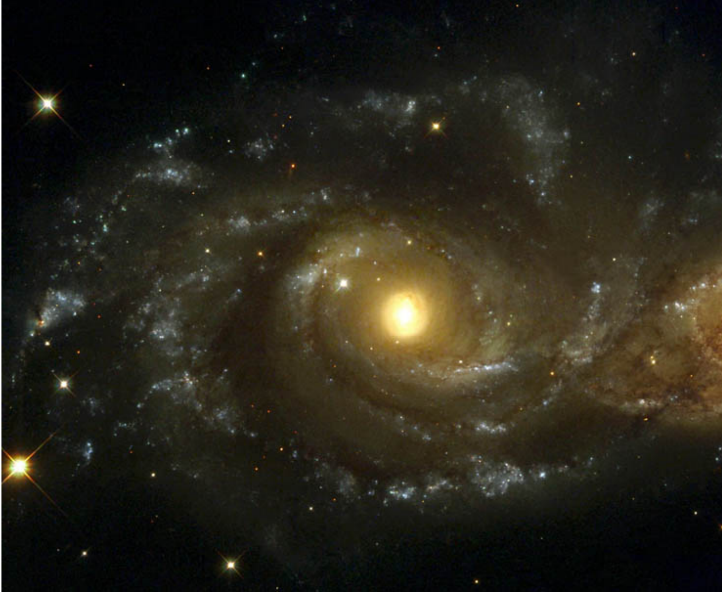
Οι γαλαξίες NGC 2207 και IC 2163 φωτογραφημένοι από το Hubble Space Telescope.

β) Η λεπτομερής φωτογράφιση των κέντρων των γαλαξιακών πυρήνων με ακρίβεια που δεν είχε επιτευχθεί ποτέ πριν, επιβεβαιώνοντας την ύπαρξη υπερμεγέθων μελανών οπών στα κέντρα σχεδόν όλων των γαλαξιών (και όχι μόνον των AGN).