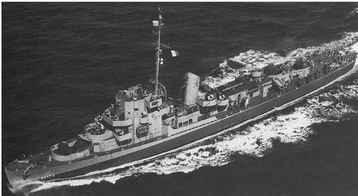
Το αμερικανικό αντιτορπιλικό Eldridge DE-173 που λέγεται ότι συμμετείχε στο πείραμα της Φιλαδέλφειας.