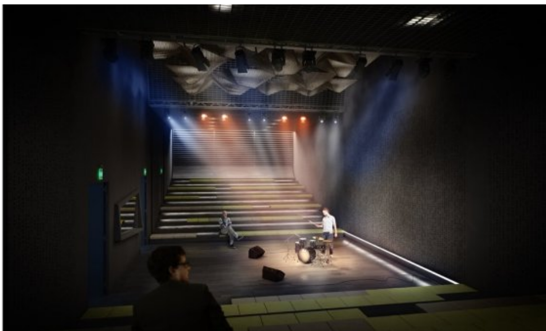
‘Black box’ δυναμικότητας 200 θέσεων με κατεύθυνση τον ηλεκτρονικό ήχο Κεντρική σκηνή με δύο αμφιθεατρικές ενότητες πτυσσόμενων καθισμάτων