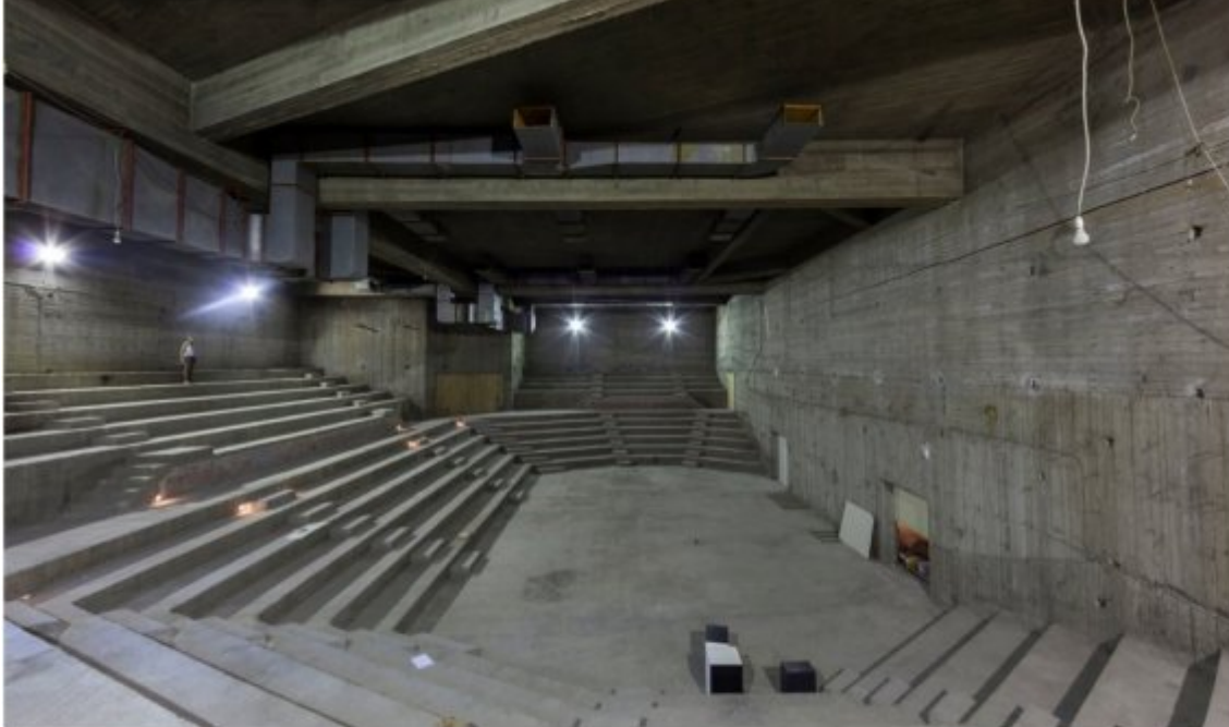
Εντυπωσιακότερος και σημαντικότερος χώρος του κτιρίου, το αμφιθέατρο για 600 θεατές, δίνει την ψευδαίσθηση αρχαίου θεάτρου σε κλιμακωτή διάταξη