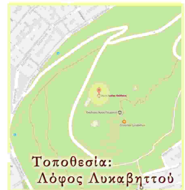
Τοποθεσία: Λόφος Λυκαβηττού

Κατά την διάρκεια των Ιερών Ακολουθιών θα τίθεται για προσκύνημα Ιερό Λείψανο του Αγίου.