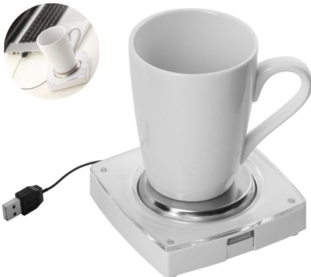
USB cup warmer Coffee cup

Μπορεί αυτή η πρόταση να μην είναι ακριβώς αυτό που λέμε «γλυκιά» και «χαριτωμένη», μπορούμε όμως να σας διαβεβαιώσουμε ότι θα δώσει χαρά σε κάθε λάτρη του καφέ που δουλεύει ώρες εκτός σπιτιού. Η θερμαινόμενη εστία κρατάει το ρόφημα ζεστό καθ' όλη τη διάρκεια της ημέρας και η δασκάλα ή ο δάσκαλος του παιδιού θα σας ευγνωμονούν.