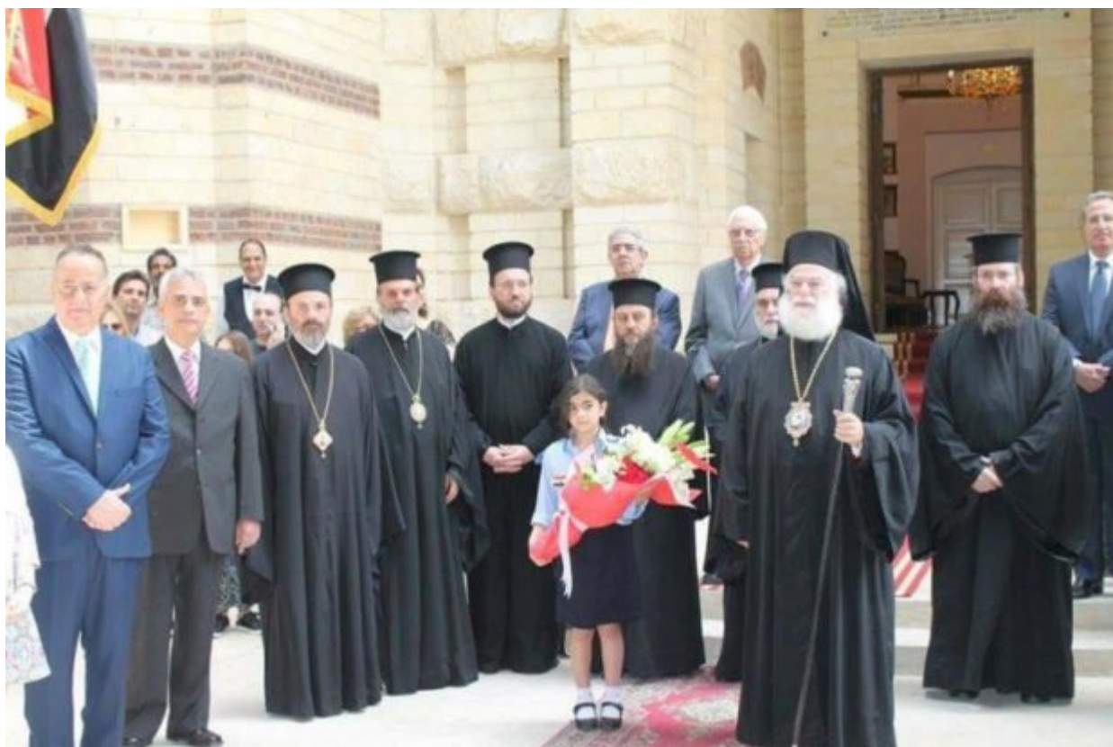
Ο Μακαριώτατος Πάπας και Πατριάρχης Αλεξανδρείας και πάσης Αφρικής Πατριάρχου Αγίου