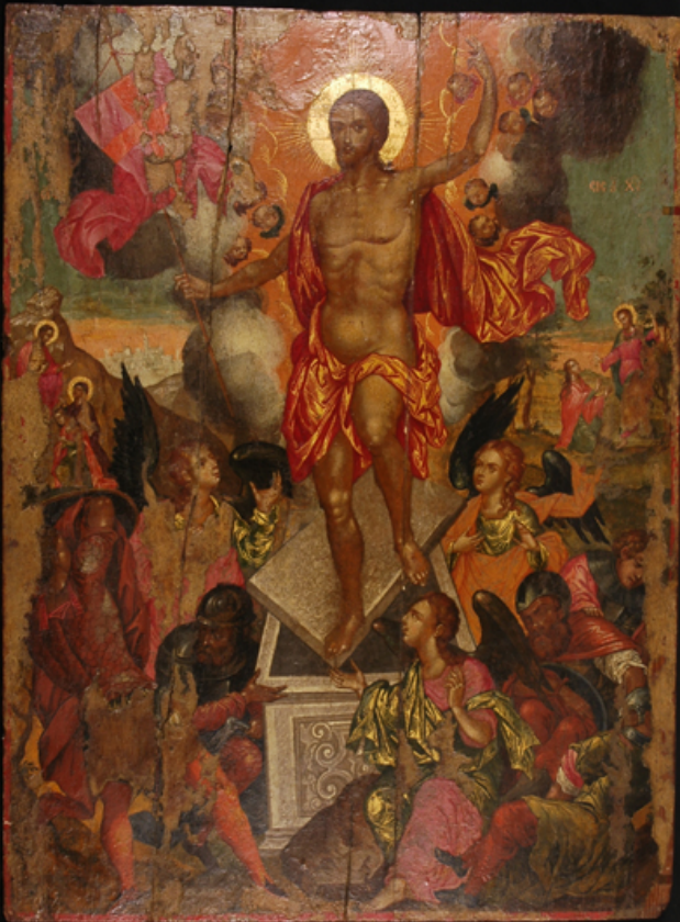
Η Ανάσταση του Χριστού, Φορητή Εικόνα Ηλία Μόσκου, 1679