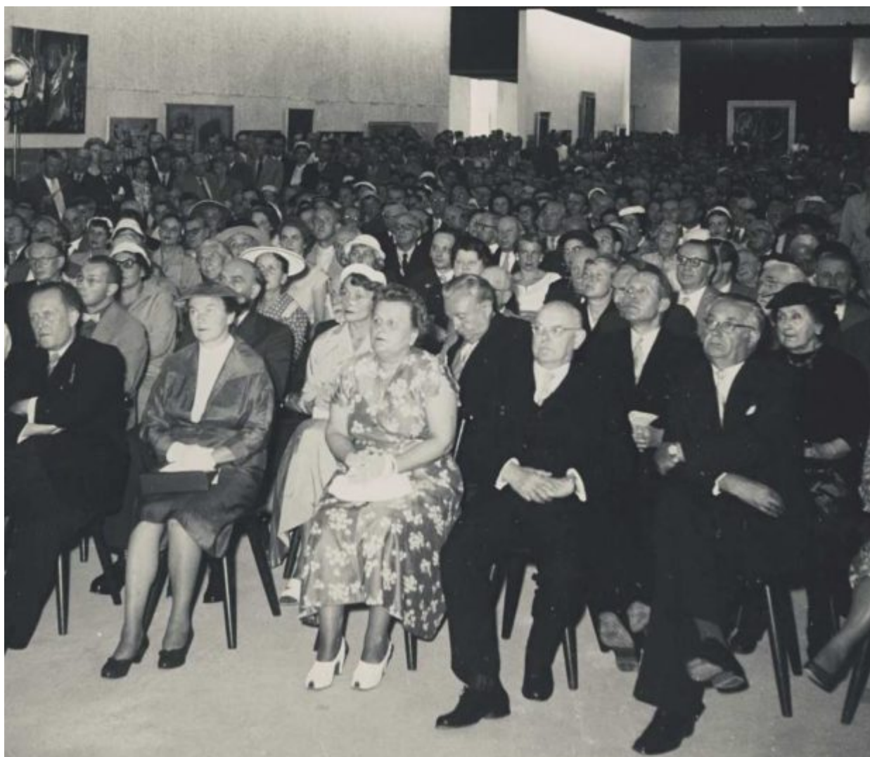
Τα εγκαίνια της πρώτης έκθεσης Documenta στο Κάσελ, το 1955

Στόχος και φιλοδοξία του ήταν να επαναφέρει την αβαντ γκαρντ στη χώρα όπου μεσουρανούσε προτού αναλάβει ο Χίτλερ την εξουσία και να γνωρίσει η γενιά που μεγάλωσε μέσα στο Γ' Ράιχ του μεγάλους καλλιτέχνες του ευρωπαϊκού μοντερνισμού.