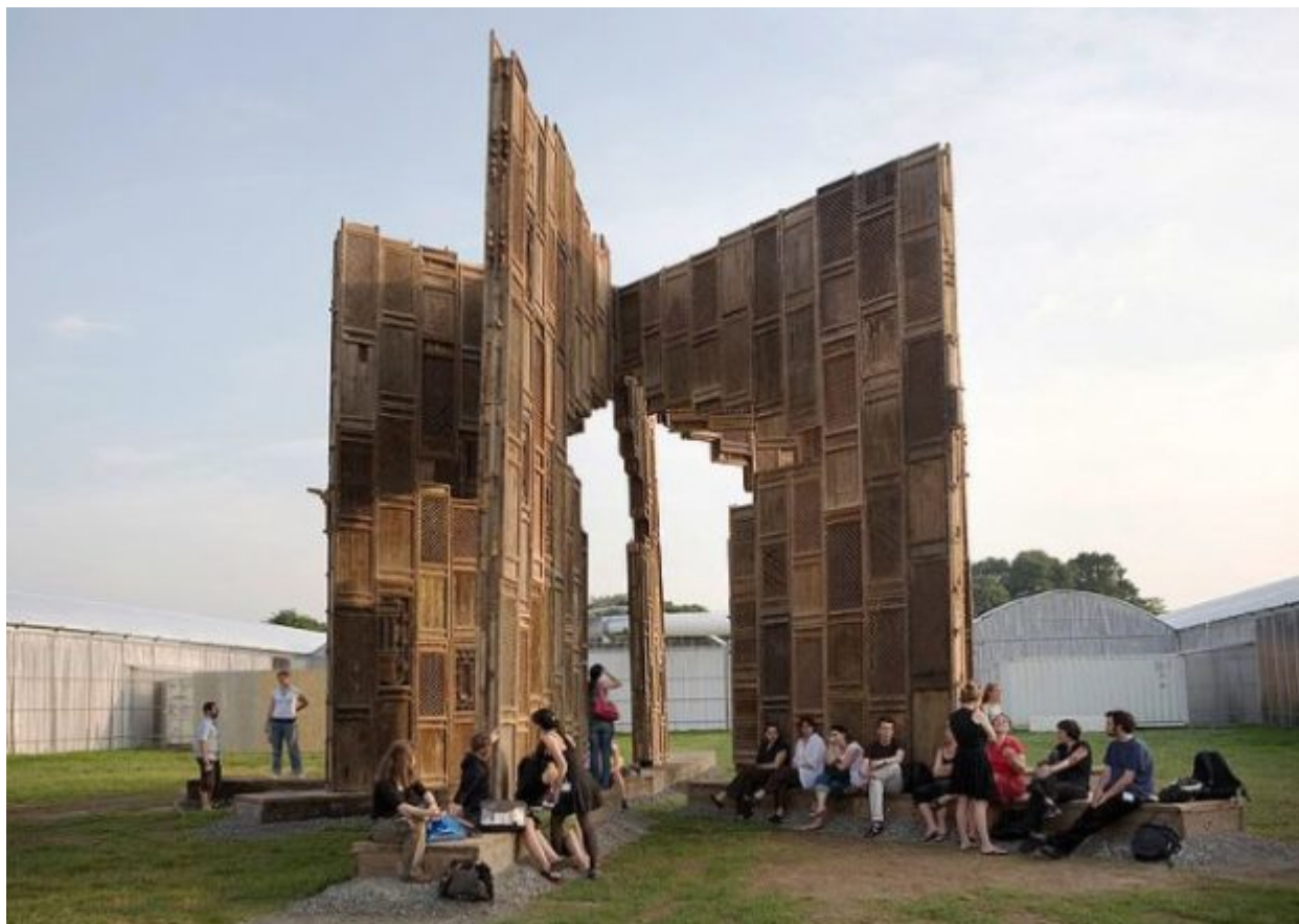
Ο ξύλινος ναός του διάσημου καλλιτέχνη Αϊ Γουέι Γουέι στη Documenta 12, το 2007

Στο μεταξύ, το Κάσελ όπου παρεμπιπτόντως γεννήθηκαν, έζησαν και πέθαναν οι αδερφοί Γκριμ, εξελίχθηκε σε μια μουντή βιομηχανική πόλη 280.000 κατοίκων οι οποίοι βιοπορίζονται κυρίως από το γειτονικό εργοστάσιο της Volkswagen. Είναι μια πόλη παντελώς αδιάφορη με μια πρώτη ματιά και μοιάζει να ζει μια πενταετή χειμερία νάρκη από την οποία ξυπνά μόνο για να υποδεχθεί τους επισκέπτες της documenta (στους 905.000 το νούμερο για την προηγούμενη διοργάνωση). Κοινώς, τους διάσημους καλλιτέχνες και συχνά πιο διάσημους επισκέπτες και αστέρες, ακόμα και του Χόλιγουντ. Είναι χαρακτηριστικό ότι χρειάζεται να σου υποδείξει κάποιος ότι από τις 13 διοργανώσεις που έχουν ζωντανέψει μέχρι στιγμής το Κάσελ έχουν μείνει πίσω 25 έργα για να θυμίζουν, διακριτικά, τον τυφώνα που χτυπάει την πόλη ανά πενταετία. Όπως η βελανιδιά που είχε φυτέψει ο Γιόζεφ Μπόις στην πλατεία έξω από το Μουσείο Fridericaneum. Ήταν η πρώτη από τις «7.000 βελανιδιές», ένα φιλόδοξο πρότζεκτ στο πλαίσιο της documenta 7 (1982) μέσω του οποίου ο γερμανός εικαστικός φιλοδοξούσε να προκαλέσει την πράσινη ανάπτυξη της πόλης. Το Κάσελ τιμάει την ιστορία της Documenta και νιώθει περήφανο γι αυτή. Παρ' όλα αυτά δεν υπήρξαν έντονες αντιδράσεις όταν ανακοινώθηκε η εξ ημισείας διοργάνωση με την Αθήνα.