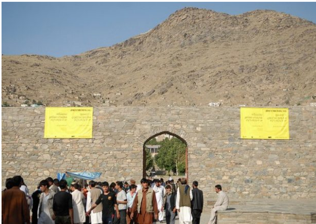
Η Documenta 11 στην Καμπούλ

Όταν ανέλαβε τα ηνία ο 47χρονος Πολωνός Ανταμ Σίμτσικ είχε ήδη αποφασίσει ότι ήθελε να αφήσει το στίγμα του πηγαίνοντας τη διοργάνωση ένα μεγάλο βήμα παραπέρα. Μόνιμος επισκέπτης της Ελλάδας τα τελευταία χρόνια -η σύζυγός του και performance artist Αλεξάνδρα Μπαχτσετζή έχει εξάλλου ελληνική καταγωγή- ανακοίνωσε το 2014 ότι η Documenta 14 θα διεξαχθεί ισότιμα ανάμεσα στην Αθήνα και το Κάσελ. Για να γίνει μάλιστα αυτό πράξη για όποιον επιθυμεί και έχει τα μέσα να επισκεφτεί και τις δυο πόλεις, η Aegean πραγματοποιεί τη σύνδεση Αθήνας-Κάσελ με μια απευθείας πτήση δυο φορές την εβδομάδα μέχρι τις 23 Ιουνίου 2017 (η έκθεση στη Γερμανία ξεκινάει στις 10 Ιουνίου). Ενας από τους λόγους που οδήγησαν τον καλλιτεχνικό διευθυντή της documenta 14 σε αυτή τη «διχοτόμηση», ήταν η άποψη ότι έπρεπε να επαναπροσδιοριστεί ο ρόλος του καλλιτεχνικού αυτού γεγονότος διότι είχε απομακρυνθεί πολύ από το αρχικό όραμα του Μπόντε και κολάκευε, υπό μια έννοια, τις προσδοκίες του κοινού και της αγοράς της τέχνης. Ο Σίμτσικ και η ομάδα του, ένα επιτελείο από διεθνείς επιμελητές, έκαναν απόβαση στην Αθήνα διαβεβαιώνοντας τους Έλληνες -αλλά και τους εαυτούς τους- ότι δεν θα υποπέσουν στην ευκολία του εξωτισμού ούτε θα έρθουν ως αποικιοκράτες εις άγρην σύγχρονων ερειπίων τα οποία ως γνωστόν, αφθονούν στο αθηναϊκό αστικοκοινωνικό τοπίο.