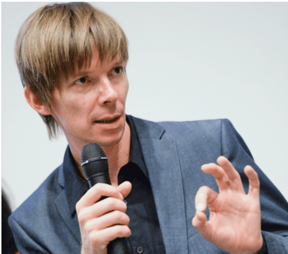
Ο καλλιτεχνικός διευθυντής της documenta 14, Ανταμ Σίμτσικ

Όσον αφορά στα έργα που παρουσιάζονται σε αυτόν τον θεσμό παγκόσμιας εμβέλειας, το μεγάλο άλμα προς τις χώρες των οποίων η καλλιτεχνική παραγωγή υποεκπροσωπείται διεθνώς, έγινε με την Documenta 11 (2002) όταν ο νιγηριανός Okwui Enwezor έκανε ένα μεγάλο άνοιγμα προς την τέχνη της Αφρικής, της Ασίας και της Λατινικής Αμερικής. Η γεωγραφική επέκταση του θεσμού από την άλλη, ξεκίνησε με τη documenta 13 (2012) όταν η Αμερικανίδα Carolyn Christov-Bakargiev φρόντισε να πραγματοποιηθεί μια παράλληλη έκθεση στην Καμπούλ του Αφγανιστάν και εκδηλώσεις σε Κάιρο και Αλεξάνδρεια. Η μεν προσέλκυσε 27.000 επισκέπτες οι δε εξαρχής δεν ήταν ανοιχτές σε μεγάλο κοινό.