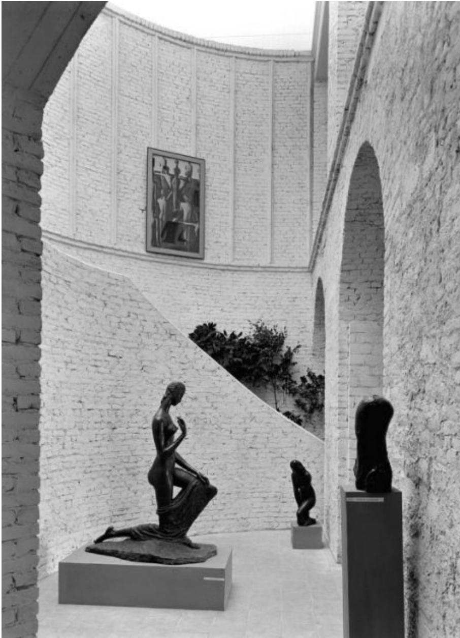
Το γλυπτό «Kneeling Woman» του Wilhelm Lehmbruck μέσα στο Μουσείο Fridericaneum

είχε νικήσει. Το Κάσελ με το αμαρτωλό παρελθόν βρέθηκε στην αιχμή της πρωτοπορίας και της τέχνης που πρέσβευε ακριβώς ό,τι μισούσαν οι ναζί.