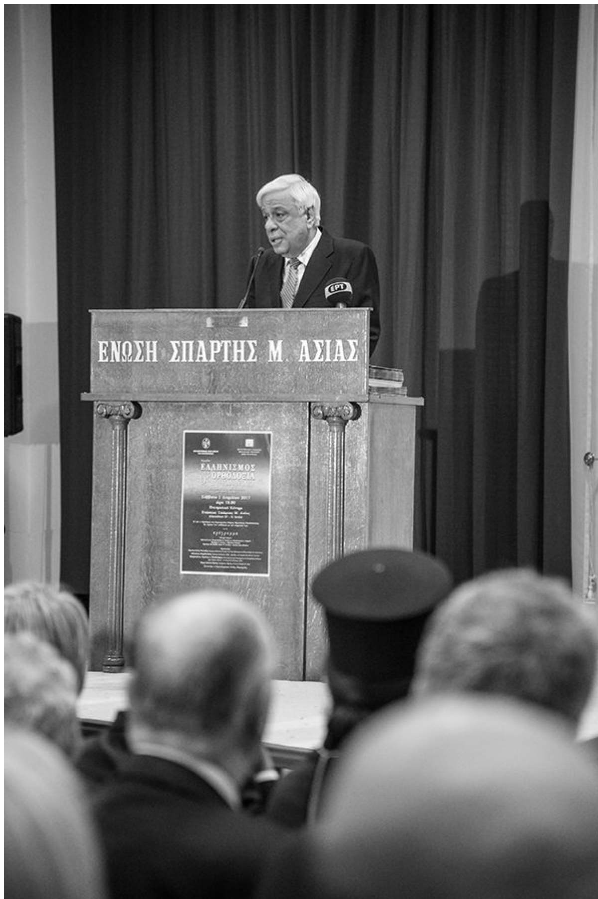
Ο κ. Παυλόπουλος ανέφερε χαρακτηριστικά: «με πραγματική συγκίνηση κηρύσσω την έναρξη αυτής της εκδήλωσης, που είναι αφιερωμένη στον Ελληνισμό και στην