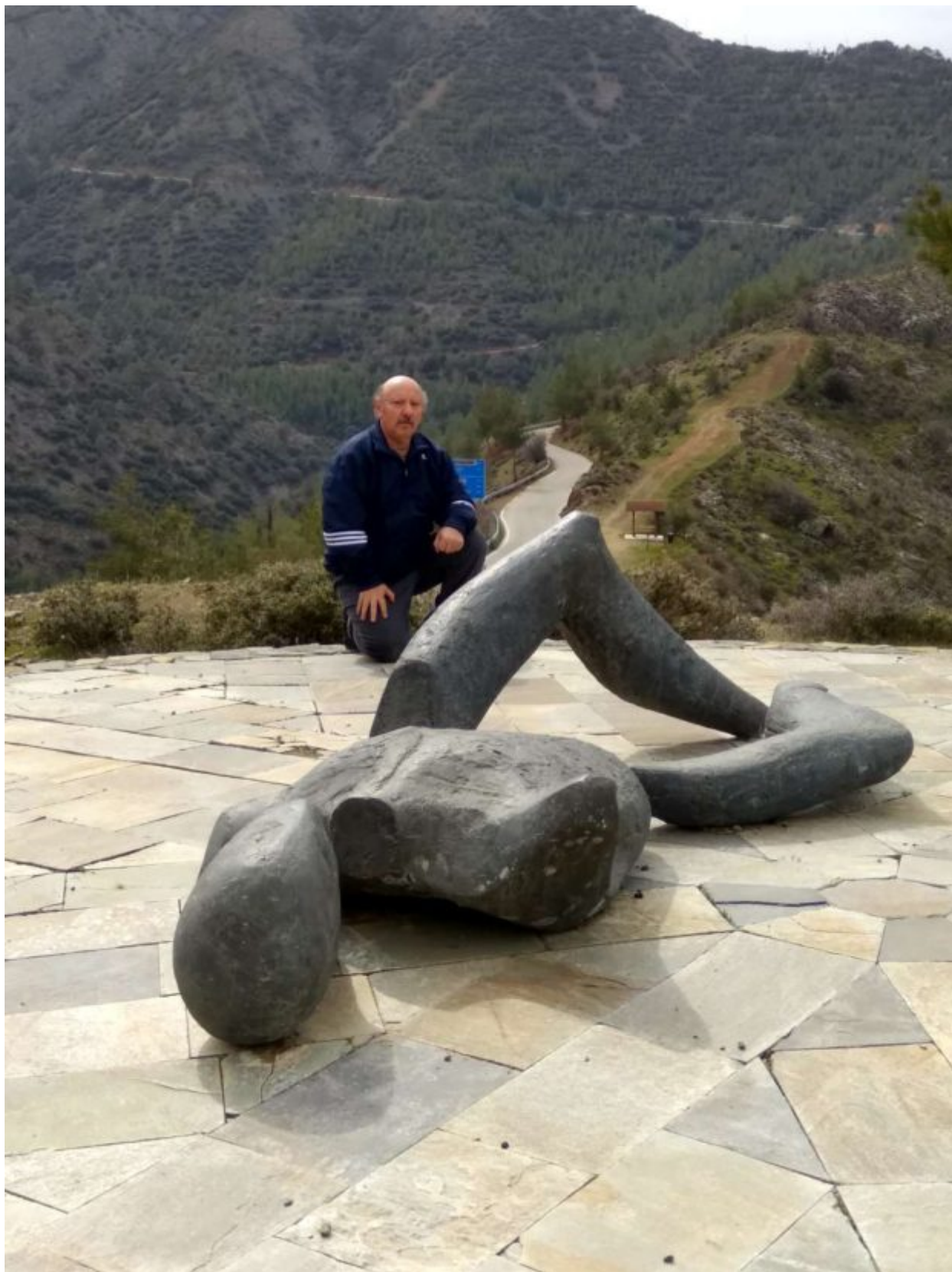
Τούτη η Άνοιξη είναι του Γρηγόρη ! Μας περιμένει στο Αλώνι του Μαχαιρά.