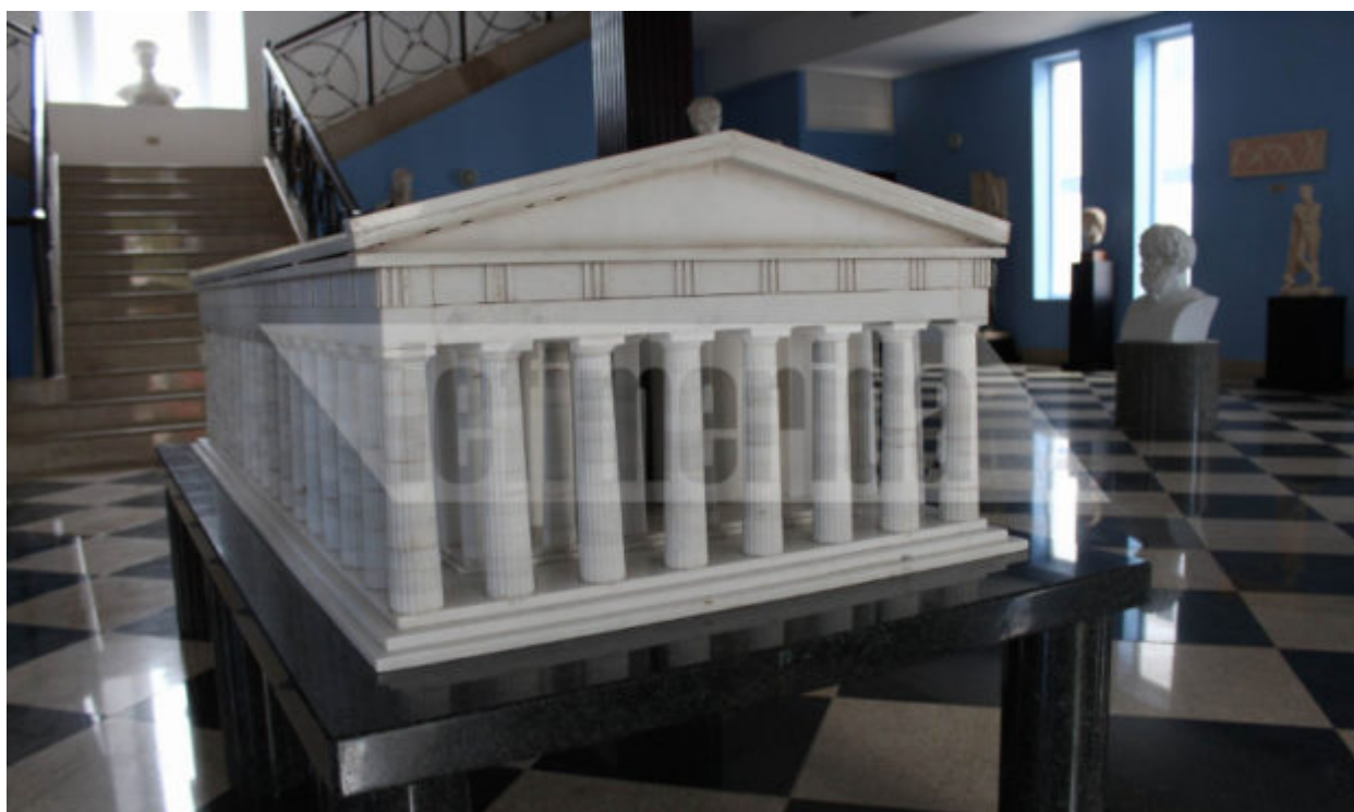
Μια μικρογραφία του Παρθενώνα στο μουσείο του ελληνικού σχολείου Παναμά

Μεγάλες ελληνικές επιχειρήσεις στον Παναμά