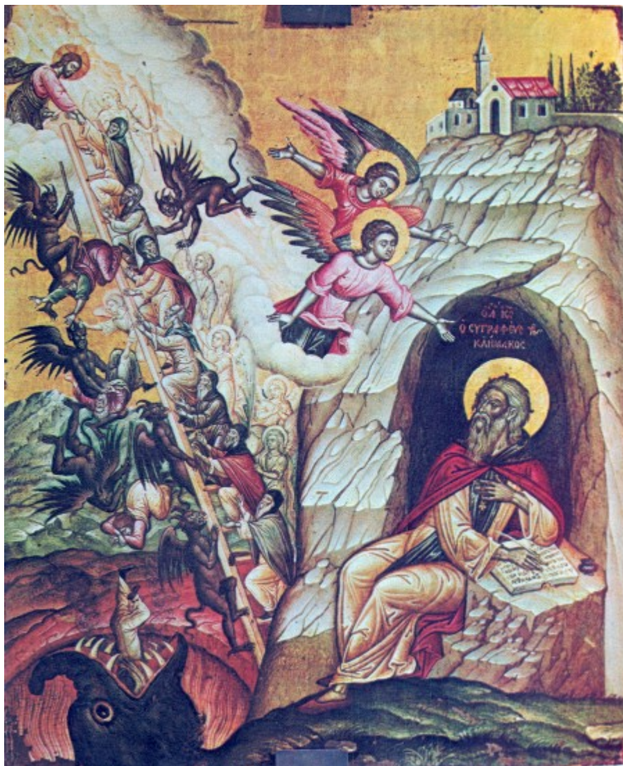
Η παράσταση της Κλίμακος, Εμμαν. Τζάνε 1663.Ι.Ν. Αγ.Γεωργίου, Βενετίας

Την Δ' Κυριακή των Νηστειών η Ορθόδοξη Εκκλησία μας γιορτάζει τη μνήμη του οσίου Ιωάννου του συγγραφέως της Κλίμακος. Όπως είναι γνωστό, η μνήμη του τελείται στις 30 Μαρτίου, αλλά οι άγιοι Πατέρες καθόρισαν η ακολουθία του να ψάλλεται την Δ' Κυριακή των Νηστειών ίσως επειδή όλον αυτό τον καιρό της νηστείας, στα περισσότερα ορθόδοξα Μοναστήρια, κατά μία παλαιά παράδοση, αναγιγνώσκεται συνέχεια το κατανυκτικότετο και πνευματικότετο έργο του, που λέγεται «Κλίμαξ». (περισσότερα...)