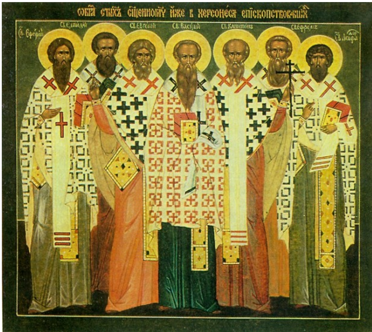
Οι Άγιοι Εφραίμ, Βασιλεύς, Ευγένιος, Αγαθόδωρος, Ελπίδιος, Καπίτων και Αιθέριος