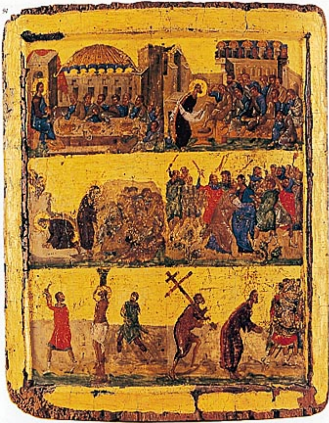
Έξι σκηνές των Παθων. Μ.Βλατάδων β΄ μισό 14ου αι.

Πώς να περιγράψουμε τα αποτελέσματα της θυσίας του Σταυρού; Ας ανοίξουμε την Αγία Γραφή και ας δανειστούμε εικόνες, που εικονίζεται το απολυτρωτικό έργο του Χριστού.