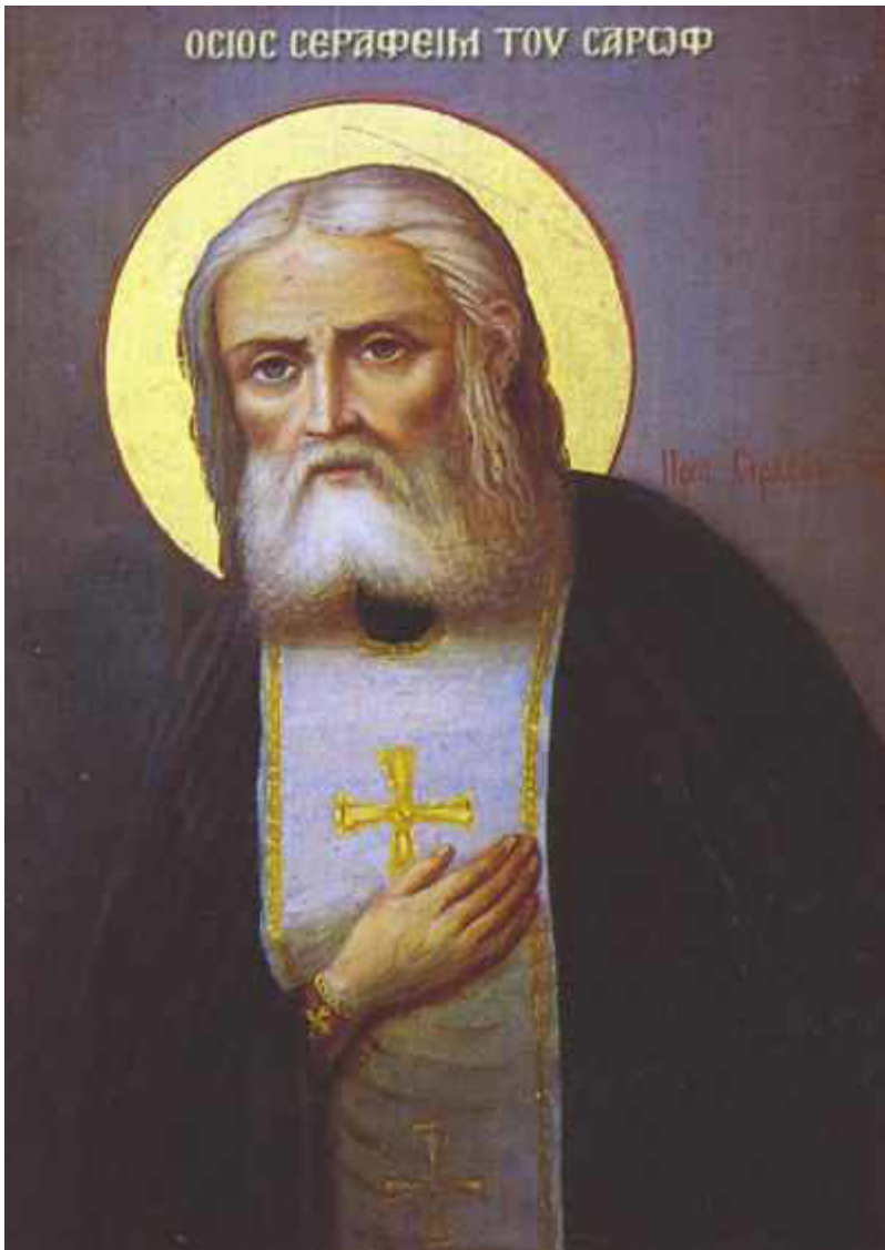
Όσιος Σεραφείμ του Σαρώφ