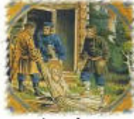
Ληστές τον χτυπούν