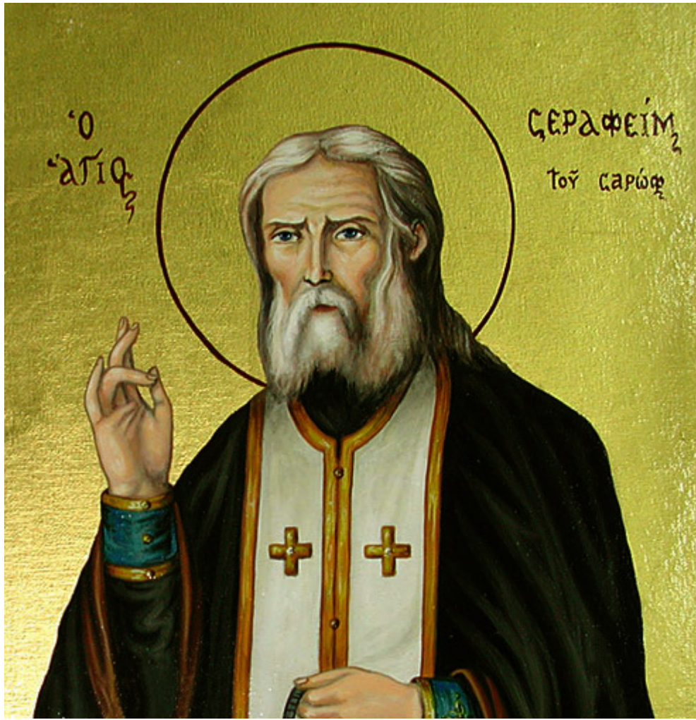
Όσιος Σεραφεΐμ του Σαρώφ