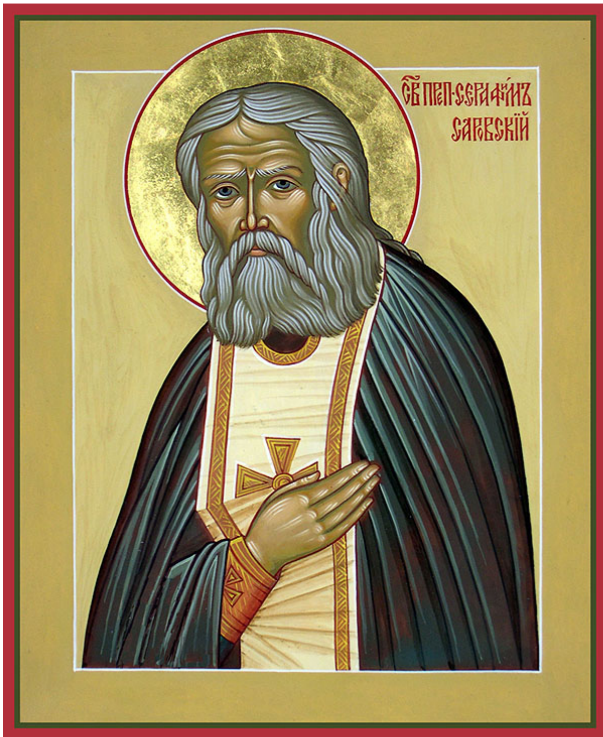
Όσιος Σεραφείμ του Σαρώφ

Εορτάζει στις 2 Ιανουαρίου εκάστου έτους.