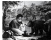
Ταΐζει την αρκούδα