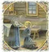
Ευλογία από την μητέρα του