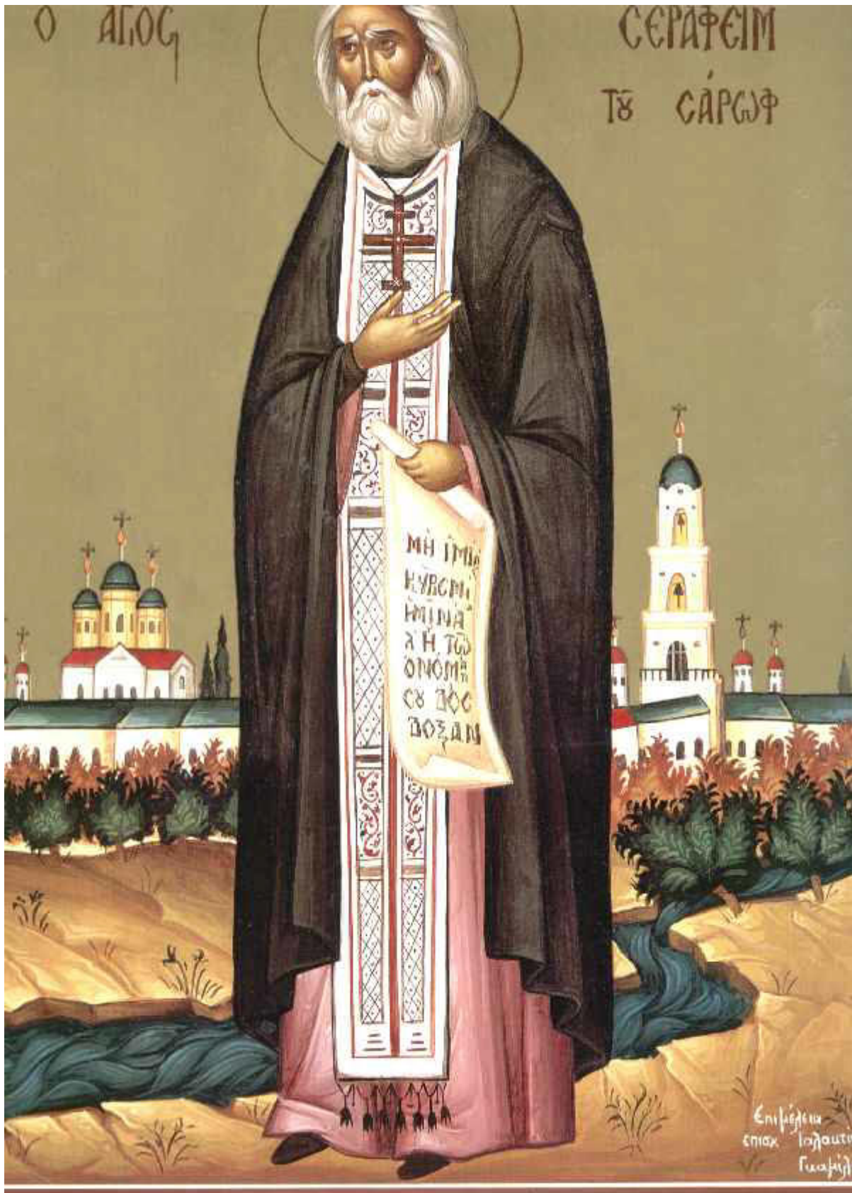
Όσιος Σεραφεΐμ του Σαρώφ