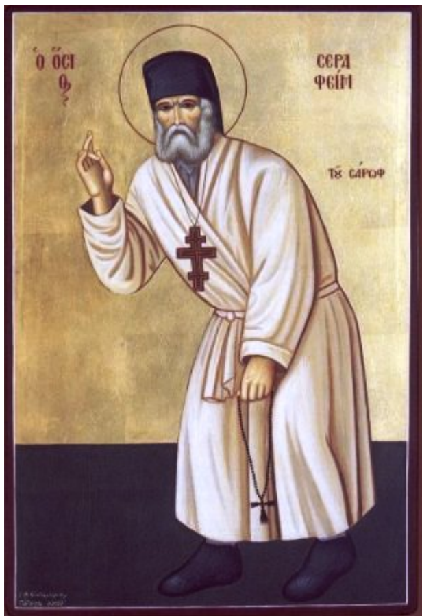
Όσιος Σεραφεΐμ του Σαρώφ