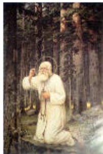
Προσευχή στο δάσος