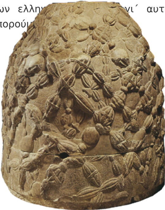
Ο «Ομφαλός» - Μουσείο Δελφών

- Φίλοι Έλληνες από όλες τις πόλεις, επισκέπτες αυτού του ιερού τόπου των Δελφών, σας καλωσορίζω στη συνέλευση της Αμφικτιονίας μας, άρχισε να μιλάει ένας από τους Ίωνες, που είχαν έδρα την Αθήνα. Παίρνω τον λόγο γιατί νιώθω βαθιά συγκινημένος που υπάρχει αυτός ο θρησκευτικός και πολιτικός σύνδεσμος μεταξύ των πόλεων μας. Αυτή η σύνδεση είναι που κρατάει την ειρήνη και τη φιλία όλων των Ελλήνων σε μια σταθερότητα. Αλλά και ο ιερός αυτός τόπος των Δελφών, ο «ομφαλός» της γης, θα αντιπροσωπεύει για πάντα την ένωση μεταξύ των ελλήνων. Γι' αυτό και πρέπει να τον τιμάμε όσο συχνότερα μπορούμε.