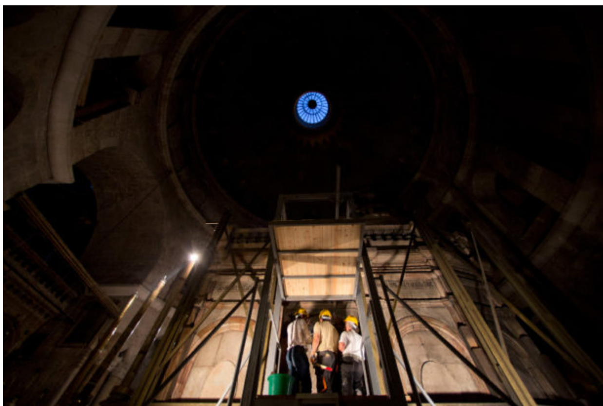
A Greek team of experts begin renovation of Jesus' tomb in the Church of the Holy Sepulchre in Jerusalem's old city, Monday, June 6, 2016. A team of experts has begun a historic renovation at the spot where Christians believe Jesus was buried, overcoming longstanding religious rivalries to carry out the first repairs at the site in over 200 years. The project, which began Monday, will focus on repairing,

Όταν συνειδητοποίησαν τι είχαμε βρει, τα γόνατά μου άρχισαν να τρέμουν».