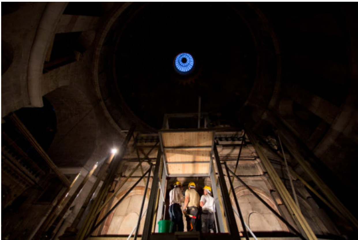
A Greek team of experts begin renovation of Jesus' tomb in the Church of the Holy Sepulchre in Jerusalem's old city, Monday, June 6, 2016. A team of experts has begun a historic renovation at the spot where Christians believe Jesus was buried, overcoming longstanding religious rivalries to carry out the first repairs at the site in over 200 years. The project, which began Monday, will focus on repairing,

Όταν συνειδητοποίησαν τι είχαμε βρει, τα γόνατά μου άρχισαν να τρέμουν».