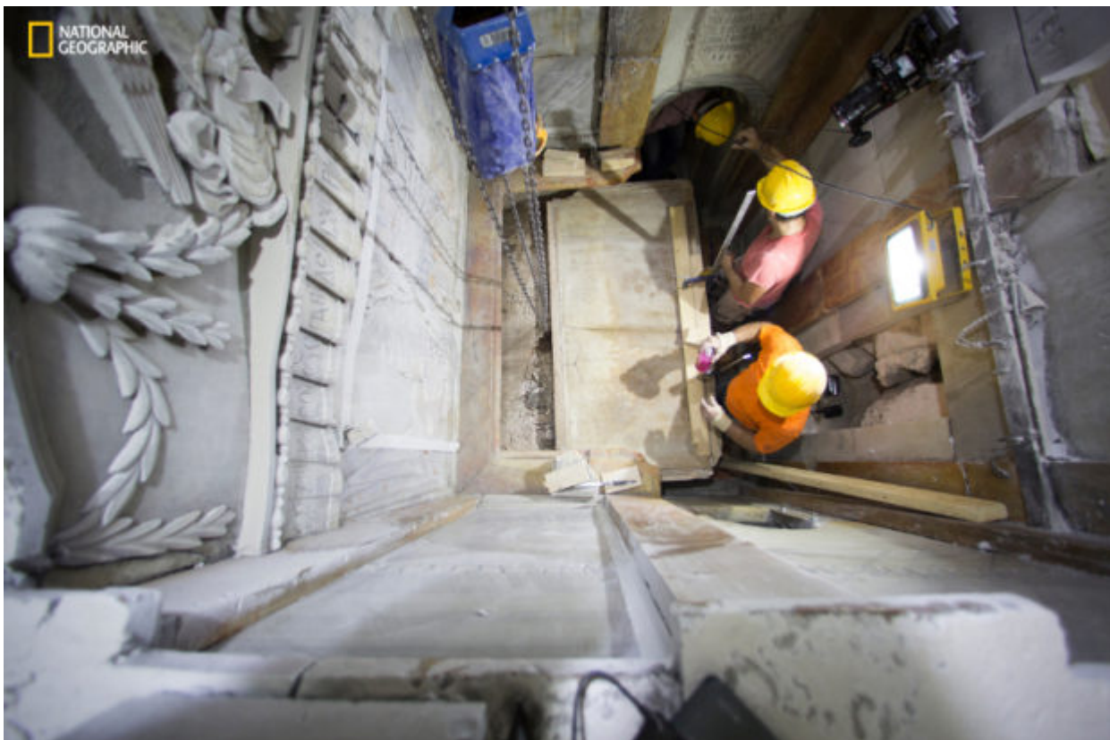
This Wednesday Oct. 26, 2016 shows the moment workers remove the top marble layer of the tomb said to be of Jesus Christ in the Church of Holy Sepulcher in Jerusalem. a restoration team has peeled away a marble layer for the first time in centuries in an effort to reach what it believes is the original

Οι ερευνητές ανακάλυψαν, επίσης, μια δεύτερη, γκρι, μαρμάρινη πλάκα, που κανείς δεν γνώριζε την ύπαρξή της. Η γκρι αυτή μαρμάρινη πλάκα έχει σκαλισμένο πάνω της έναν σταυρό. Το χαρακτηριστικό πιστεύεται ότι έγινε το 12ο αιώνα από τους Σταυροφόρους.