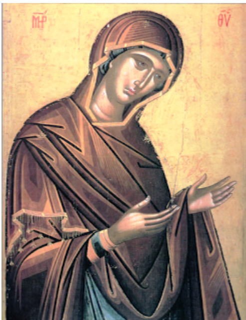
Παναγία δεομένη - Μεγάλῃς Δεήσεως- ἔτος 1542

Ὁ συγκεκριμένος φυσιογνωμικὸς τύπος τῆς Παναγίας, μὲ τὴ γλυκύτητα τῆς μελαγχολικῆς ἔκφρασης, καὶ ἡ τεχνικὴ τῆς ἐκτέλεσης ἔχουν καὶ πάλι τὴν καταγωγὴ τους στὴ ζωγραφικὴ τοῦ Ἀγγέλου, ὅπως μπορούμε νὰ τὸ διαπιστώσουμε, συγκρίνοντας τὴν Παναγία τῆς Μεγάλῃς Δεήσεως μὲ τὴν Παναγία ἀπὸ τὴ Δέησι τοῦ Ἀγγέλου στὴν Ἁγία Μονὴ Βιάννου τῆς Κρήτης.