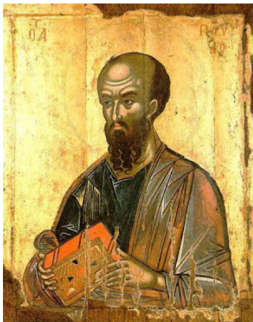
Ο Άπόστολος Παύλος ( 1542 ). Είκων εκ του Πρωτάτου "Αγίου "Ορους.

Ο Ευφρόσυνος καί ως προς τήν χρησιμοποίησιν παλαιολογείων εικονογραφικών τύπων καί ως προς τήν εφαρμογήν της παλαιολογείου τεχνικής, αλλ* υπό νέαν μορφήν, φαίνεται ακολουθών τάς αντιλήψεις καί τάς τάσεις τών Κρητών αγιογράφων τής εποχής του. Πράγματι, ό παλαιολόγειος τύπος του Παύλου, όπως ούτος τον εξωγράφησε, είναι όμοιος εις την εικόνα τού Πρωτάτου, ή οποία αποτελεί μέρος της Μεγάλης Δεήσεως καί εξωγραφήθη το αυτό έτος 1542 από άλλον άγνωστον άγιογράφον. "Όμοιον επίσης εύρίσκομεν τον Παύλον και εις τοιχογραφίας καί εις εικόνες του δευτέρου ήμίσεος τού 16ου αιώνος.