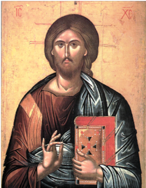
Ιησούς Χριστός - Μεγάλης Δείσεως- έτος 1542

Ο Ευφρόσυνος, γνωστός μόνο από τις πέντε εικόνες της Μεγάλης Δέησης της μονής Διονυσίου, εμφανίζεται με την τέχνη του ζωγράφου σημαντικός, σύγχρονος του Θεοφάνη Μπαθά, αντιπροσωπεύει όμως ροπή διάφορη της κρητικής ζωγραφικής. Η υπόθεση ότι ανήκει στην οικογένεια των ζωγράφων Κλόντζα είναι αστήρικτη, γιατί για το μνημονευόμενο σε έγγραφο του 1567 ως ποτε παπα κυρ Ευφρόσυνο Κλόντζα δεν υπάρχει καμιά ένδειξη ότι ήταν ζωγράφος.