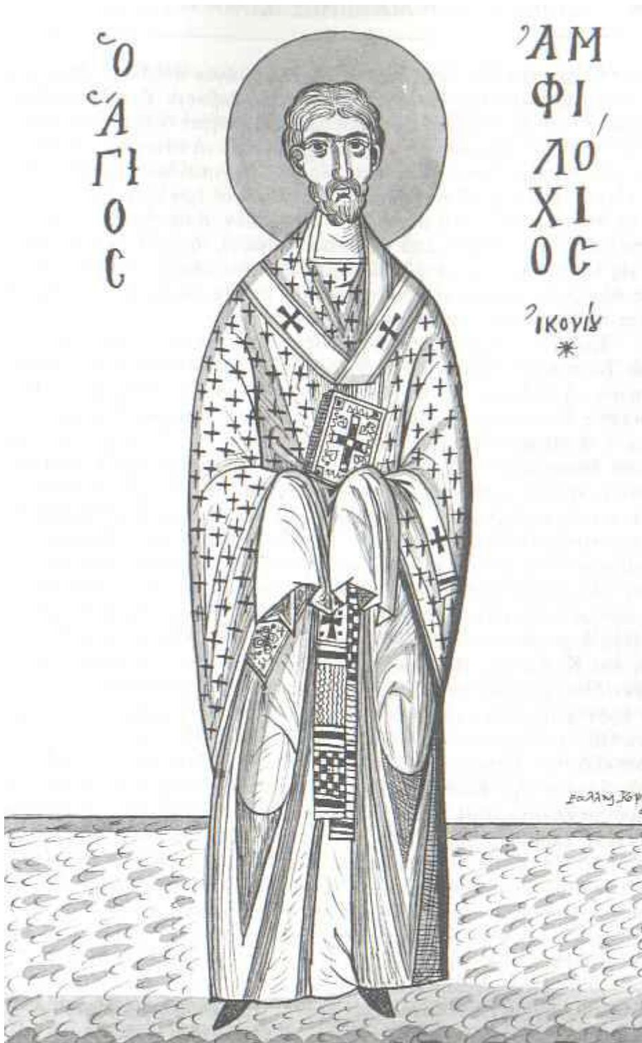
Άγιος Αμφιλόχιος Επίσκοπος Ικονίου

Άγιος Αμφιλόχιος Επίσκοπος Ικονίου - Άγιον Όρος, Μεγίστη Λαύρα