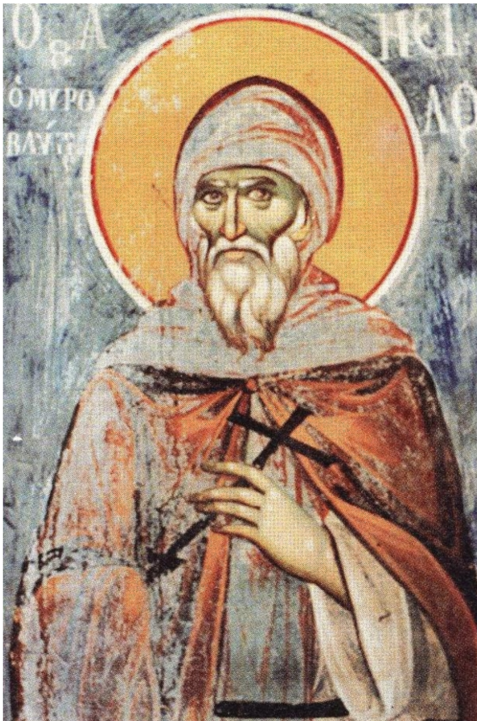
Ο Όσιος Νείλος ο Μυροβλύτης. Τοιχογραφία (1806) λιτής Κυριακού Ιεράς Σκήτews Αγίου Δημητρίου (Βατοπαιδίου).

Γεννήθηκε στην κωμόπολη Άγιος Πέτρος Κυνουρίας της Πελοποννήσου από ευσεβείς γονείς περί το 1601. Τα πρώτα γράμματα έμαθε από τον θείο του, ιερομόναχο Μακάριο, μαζί με τον όποιο ήλθε και μόνασε στην πλησιόχωρη της πατρίδος του μονή Παναγίας της Μαλεβής. Εκεί χειροτονήθηκε και Ιερέύς. Ο πόθος όμως θειότερης και ασκητικότερης ζωής τον έφερε στο περιλάλητο Άγιον Όρος.