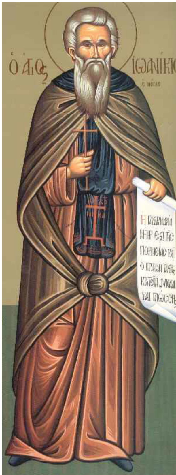
Όσιος Ιωαννίκιος ο Μεγάλος «ό έν Όλύμπω»