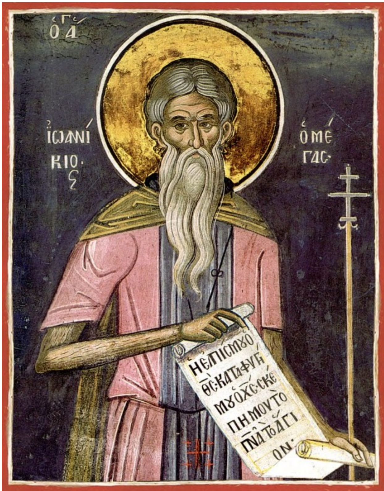
Όσιος Ιωαννίκιος ο Μεγάλος «ό έν Όλύμπω»

Εορτάζει στις 4 Νοεμβρίου εκάστου έτους.