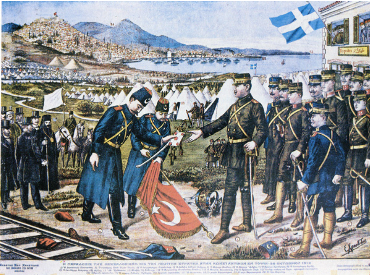
Η ΠΑΡΑΔΟΣΗ ΤΗΣ ΟΘΩΜΑΝΙΚΗΣ ΣΕ ΤΟΝ ΗΣΧΗΤΗ ΣΥΡΧΥΛΗ ΑΠΟ ΤΗΝ ΚΟΝΣΤΑΝΤΙΝΟΥΣ ΕΙΣ ΤΟΥΡΚΙΑΣ 26 ΟΚΤΩΒΡΙΟΥ 1912 Η ΠΑΡΑΔΟΣΗ ΤΗΣ ΟΘΩΜΑΝΙΚΗΣ ΣΕ ΤΟΝ ΗΣΧΗΤΗ ΣΥΡΧΥΛΗ ΑΠΟ ΤΗΝ ΚΟΝΣΤΑΝΤΙΝΟΥΣ ΕΙΣ ΤΟΥΡΚΙΑΣ 26 ΟΚΤΩΒΡΙΟΥ 1912 Η ΠΑΡΑΔΟΣΗ ΤΗΣ ΟΘΩΜΑΝΙΚΗΣ ΣΕ ΤΟΝ ΗΣΧΗΤΗ ΣΥΡΧΥΛΗ ΑΠΟ ΤΗΝ ΚΟΝΣΤΑΝΤΙΝΟΥΣ ΕΙΣ ΤΟΥΡΚΙΑΣ 26 ΟΚΤΩΒΡΙΟΥ 1912 Η ΠΑΡΑΔΟΣΗ ΤΗΣ ΟΘΩΜΑΝΙΚΗΣ ΣΕ ΤΟΝ ΗΣΧΗΤΗ ΣΥΡΧΥΛΗ ΑΠΟ ΤΗΝ ΚΟΝΣΤΑΝΤΙΝΟΥΣ ΕΙΣ ΤΟΥΡΚΙΑΣ 26 ΟΚΤΩΒΡΙΟΥ 1912

Στα καφενεία, τα οποία σ' όλη τη διάρκεια του πολέμου υπήρξαν τα κέντρα των πολιτικών και στρατηγικών συζητήσεων, υπήρχε μεγάλος συνωστισμός. Πάνω στα τραπέζια τους είχαν ανοίξει χάρτες και τα δάχτυλα έδειχναν τις διάφορες περιοχές γύρω από την πόλη. Τα μολύβια σημείωναν τις πορείες των στρατιωτικών σωμάτων, υπολόγιζαν τις αποστάσεις κι έβγαζαν τα πιθανά συμπεράσματα. Οι πιο ανυπόμονοι, παρά την κακοκαιρία, γυρνούσαν στους δρόμους, για να σβήσουν την περιέργειά τους ακούγοντας τις φήμες που ακούγονταν παντού. Ρυττούσαν κάθε γνώριμο που συναντούσαν, σχημάτιζαν γνωστούς ή σπρώχνονταν μπροστά στις πόρτες των καφενείων και διάβαζαν σχολιάζοντας τα