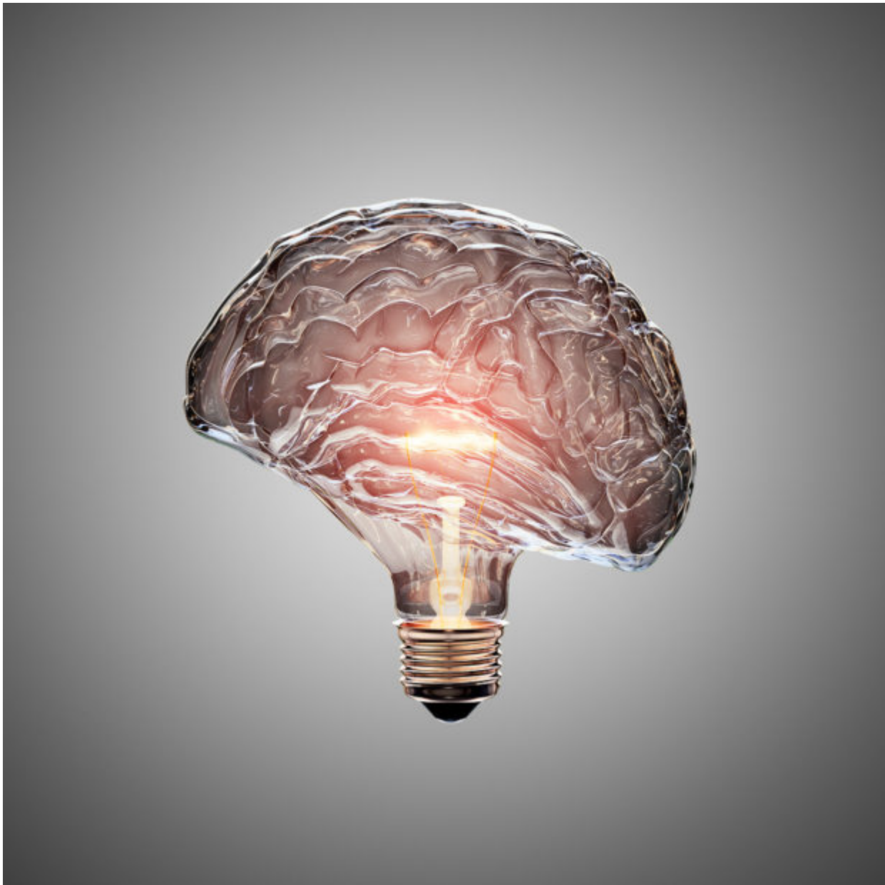
Glowing Light Bulb with the glass shaped as a Brain. This 3D illustration is conceptual of an active, creative, thinking mind or idea.

Σύμφωνα με τη Ρογκάλσκι, τα συμπτώματα που εκδηλώνει ένας ασθενής και ο τύπος της άνοιας από την οποία πάσχει καθορίζονται από την περιοχή του εγκεφάλου στην οποία εντοπίζονται οι βλάβες. Ο γιατρός δεν είναι σε θέση να γνωρίζει με βεβαιότητα σε ποια περιοχή έχει τις ρίζες της η νόσος όσο ο ασθενής είναι ζωντανός, καθώς η τελική διάγνωση είναι δυνατή μόνο μετά θάνατον, βάσει των ευρημάτων της νεκροτομής.