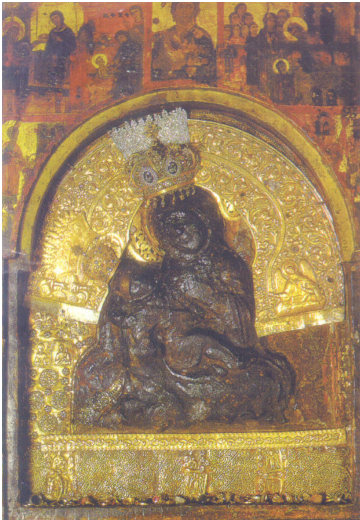
Η ανάγλυφη εικόνα της Παναγίας της Χρυσοσπηλιώτισσας, παραμένει έως και σήμερα στη Μονή Μέγα Σπηλαίου, είναι φτιαγμένη από κερί, αρώματα και μαστίχα