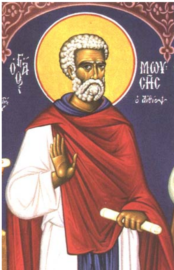
Όσιος Μωυσής ο Αιθίοπας