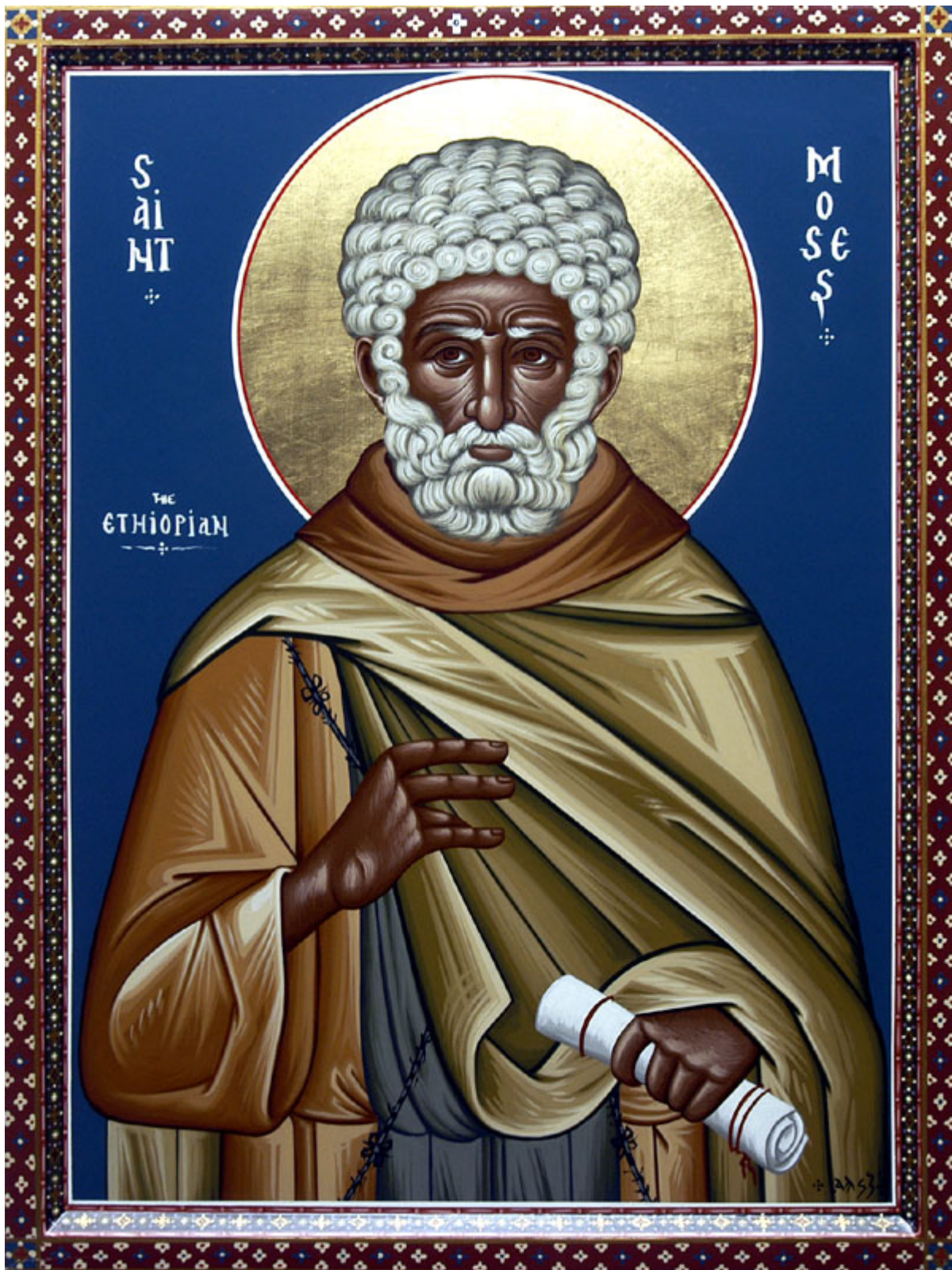
Όσιος Μωυσής ο Αιθίοπας

Εορτάζει στις 28 Αυγούστου εκάστου έτους.