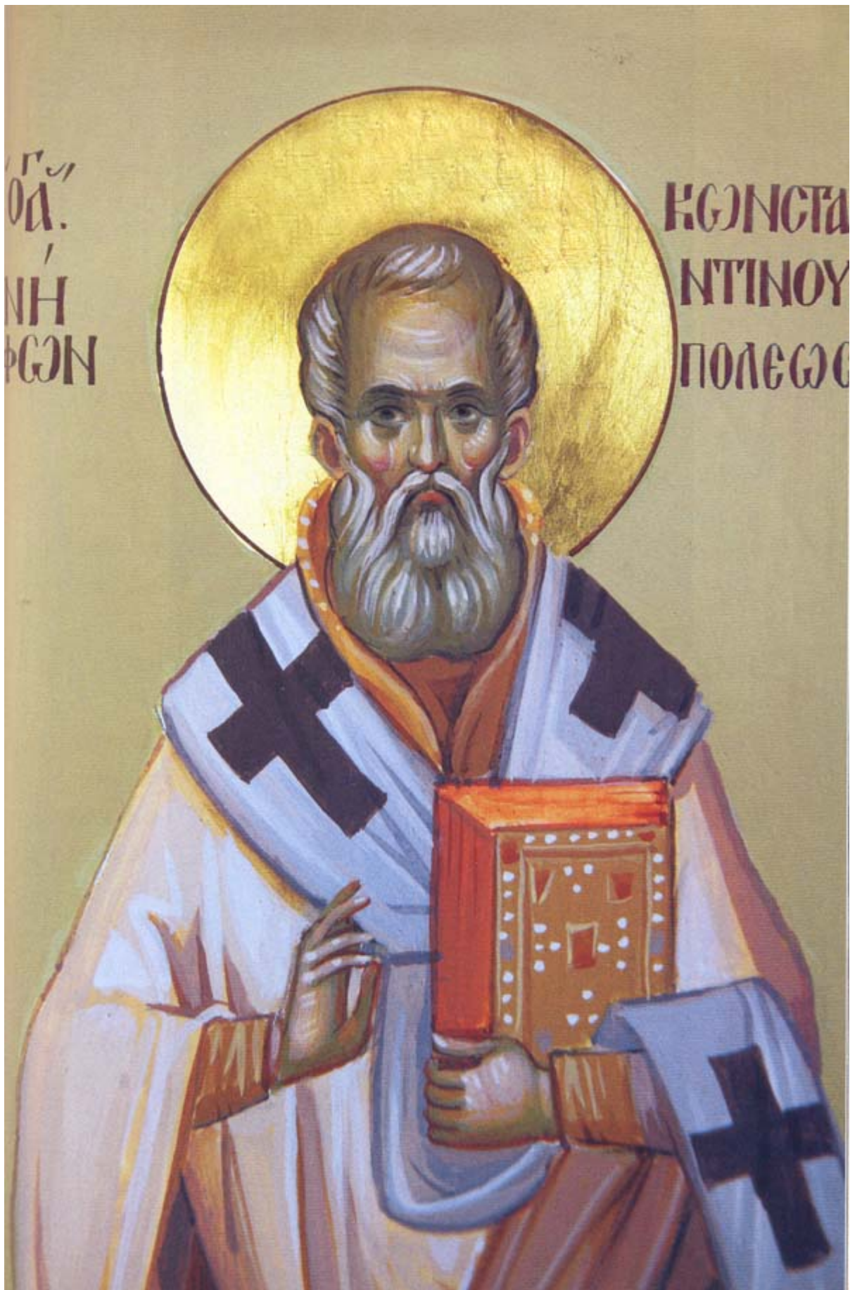
Ο άγιος Νήφων Κωνσταντινουπόλεως. Τοιχογραφία σε παρεκκλήσιο της Ιεράς Μεγίστης Μονής