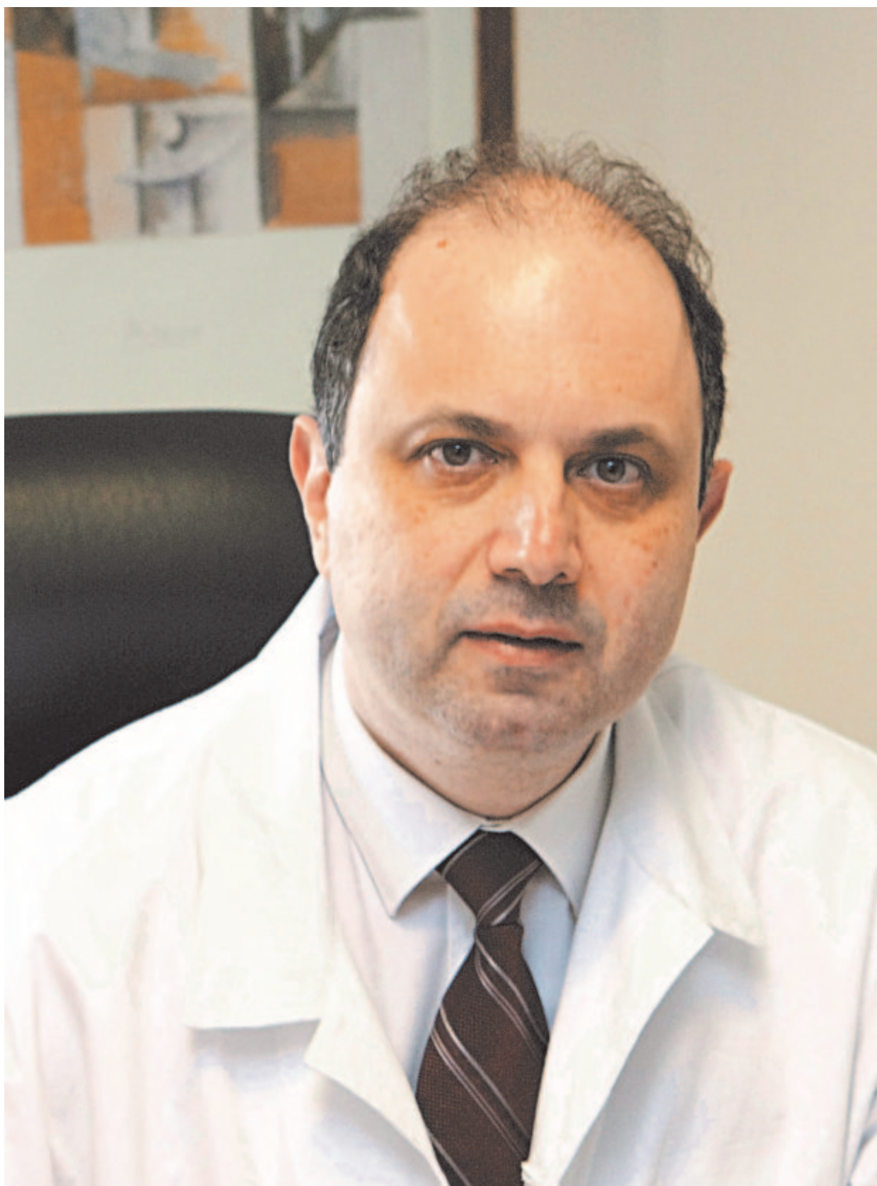
Ο κ. Κυριάκος Αναστασιάδης

Η ελληνική κλινική στην οποία γίνεται η πρωτοποριακή ερευνητική δουλειά είναι η