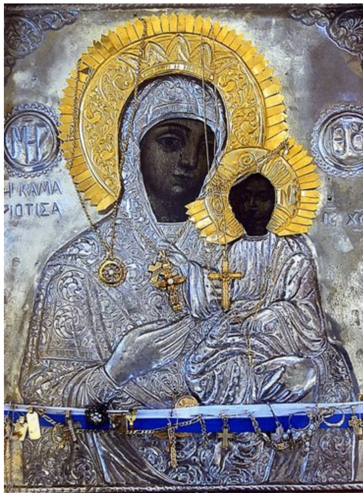
Παναγία η Εικονίστρια στη Σκιάθο