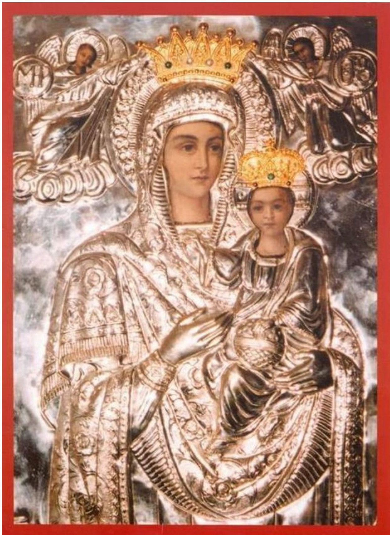
Η Παναγία στην Ι. Μ. Βλοχού