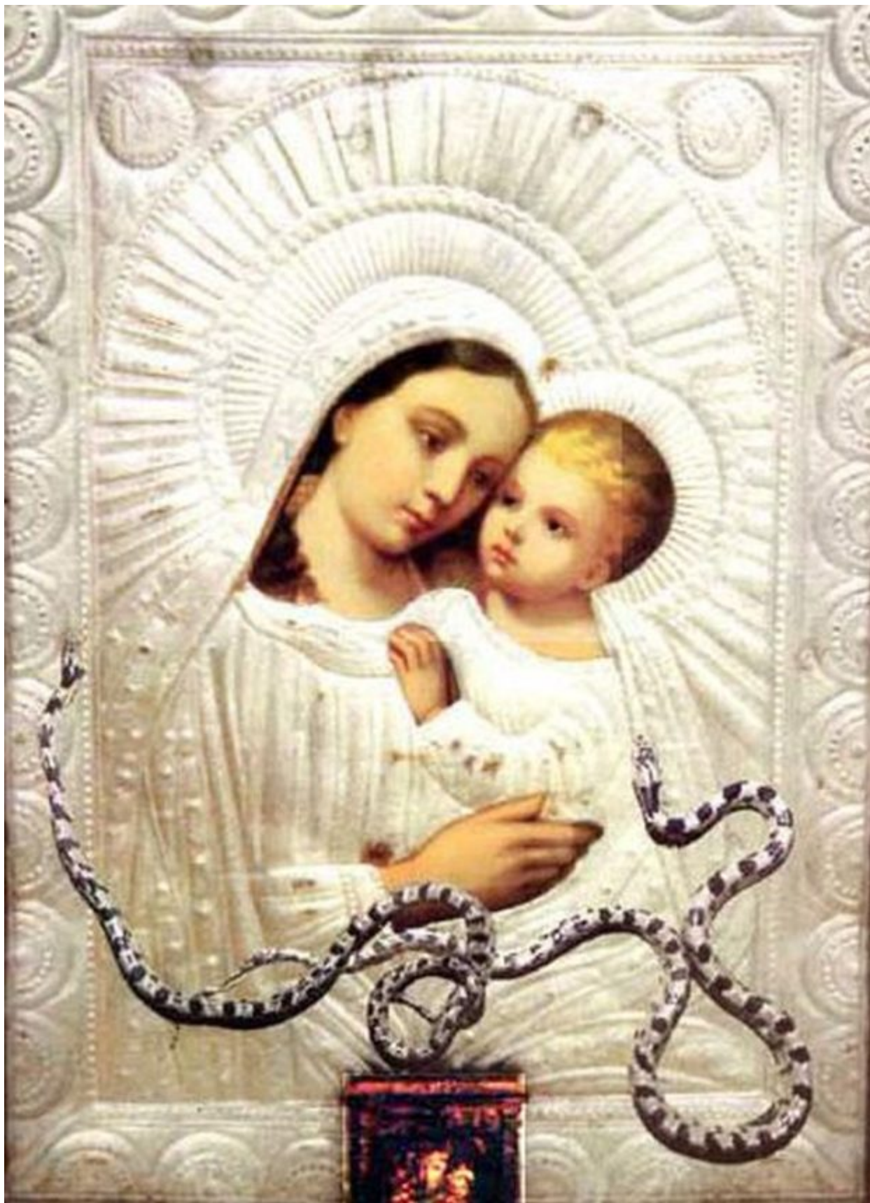
Η Παναγία Αγιασώτισσα , βρίσκεται στην Αγιάσο της Λέσβου. Η εικόνα της

παρακάλεσαν την Παναγία να τις μεταμορφώσει σε φίδια ή πουλιά και η Παναγία έκανε το θαύμα της. Κάθε χρόνο εμφανίζονται πολλά φίδια χωρίς να ενοχλούν τους πιστούς που πάνε να προσκυνήσουν την εικόνα Της