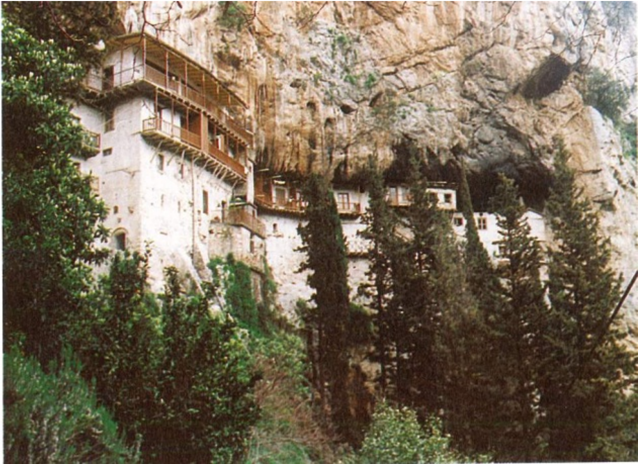
Μονή Τιμίου Προδρόμου, Στεμνίτσα Γορτυνίας

Τέσσερα χρόνια μετά τον διορισμό του ως ηγουμένου, προκειμένου να εξυπηρετηθούν οι ανάγκες της Μονής, που ουσιαστικά είχε μείνει χωρίς ιερομονάχους (οι υπάρχοντες ή ήταν γέροντες ή αρνούνταν να ιερατεύσουν), παρά την επιθυμία του ν' αποφύγει το βάρος της ιεροσύνης και να μείνει δια βίου απλός μοναχός, χειροτονήθηκε, από τον ίδιο Μητροπολίτη, το Σάββατο 29 Μαρτίου 1952 διάκονος και το Σάββατο 5 Απριλίου 1952 πρεσβύτερος στην εκκλησία του Αγίου Νικολάου Μεγαλοπόλεως. Την ίδια ημέρα της χειροτονίας του σε πρεσβύτερο χειροθετήθηκε αρχιμανδρίτης και πνευματικός. Πρωτολειτούργησε ως ιερέας την επομένη, Ε΄ Κυριακή των Νηστειών (6 Απριλίου 1952), στο χωριό Χράνοι Μεγαλοπόλεως, μαζί με τον τότε αρχιμανδρίτη και κατόπιν μητροπολίτη Γυθείου Σωτήριο Κίτσο. Αργότερα, από τις 28 Σεπτεμβρίου ως τις 5 Δεκεμβρίου 1958, παρακολούθησε μαθήματα στο Φροντιστήριο Πνευματικών της Μονής Πεντέλης Αθηνών.