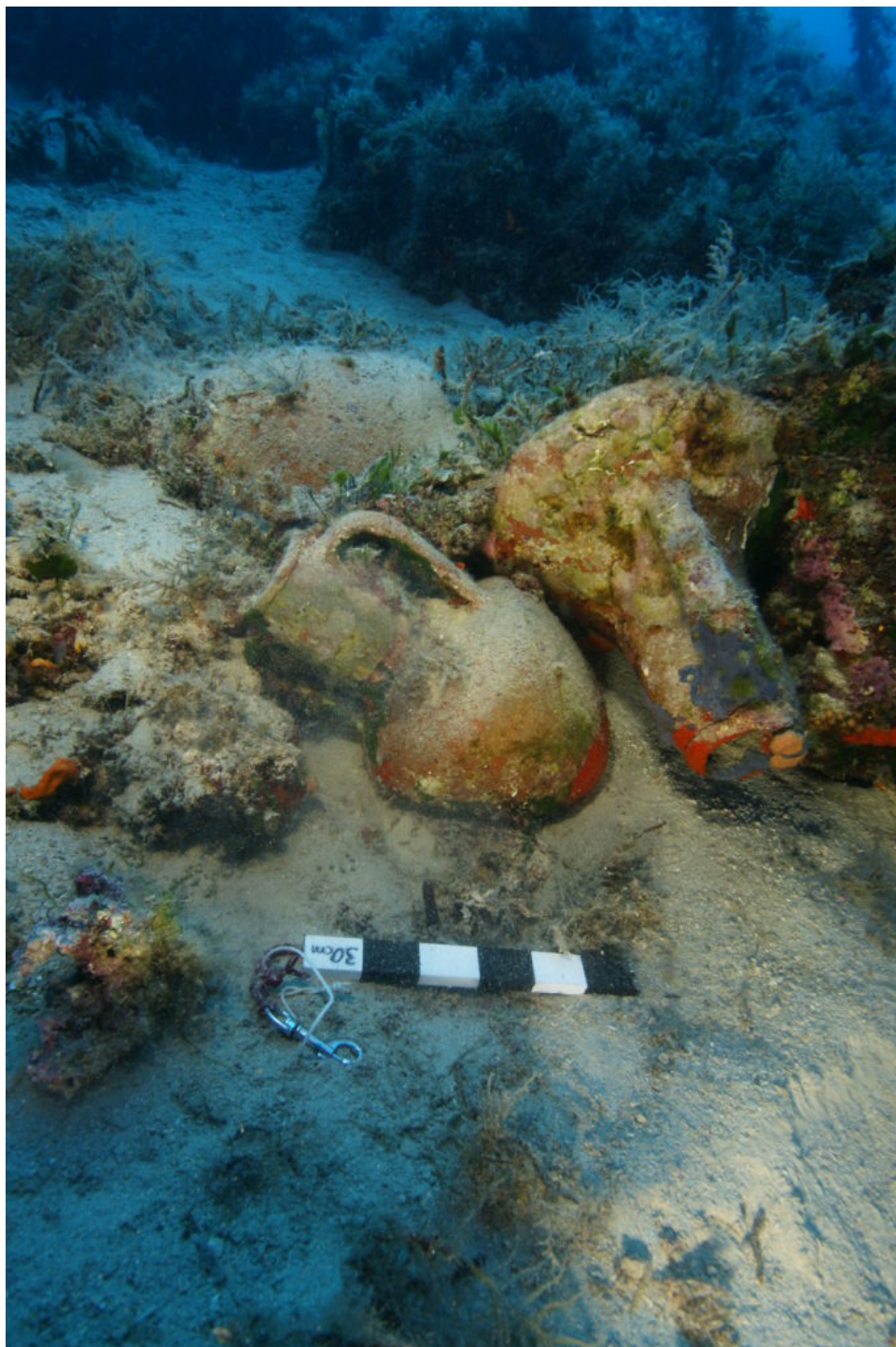
κνιδιακοί αμφορείς από ναυάγιο στον Αγ. Μηνά Φούρνων

Η επιφανειακή διερεύνηση πραγματοποιήθηκε με τη χρήση αναπνευστικών συσκευών και επικεντρώθηκε κυρίως στην παράκτια ζώνη και σε βάθη έως και 65 μέτρα.