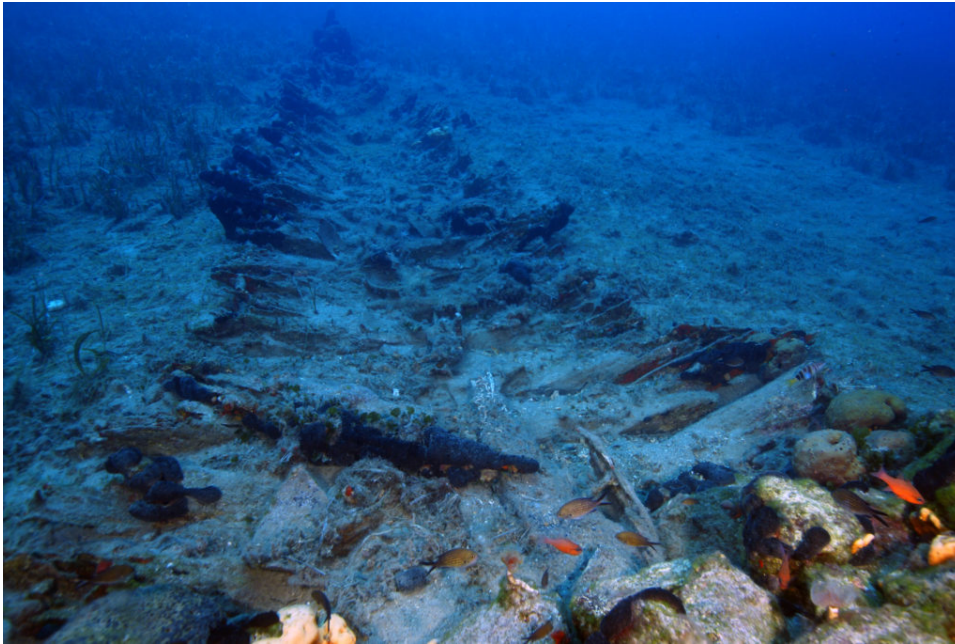
σκαρί ναυαγίου του 18ου αιώνα από το Μπαλί Φούρνων

Την γενική διεύθυνση της έρευνας, είχε ο αρχαιολόγος της Εφορείας Εναλίων Αρχαιοτήτων δρ Γιώργος Κουτσοφλάκης.