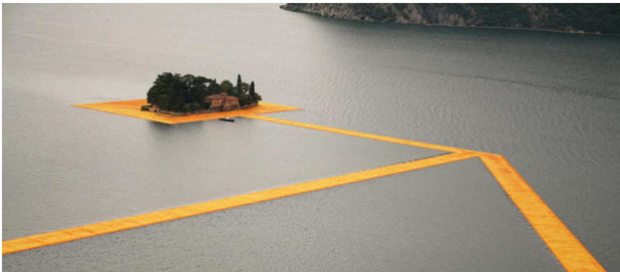
The Floating Piers

Ο Christo δημιουργεί μία πλωτή διαδρομή πάνω στη λίμνη Ιζέο της Ιταλίας.