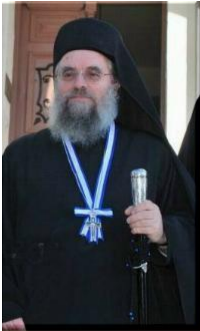
Ο απερχόμενος Πρωτεπιστάτης Γέρων Παύλος Λαυριώτης