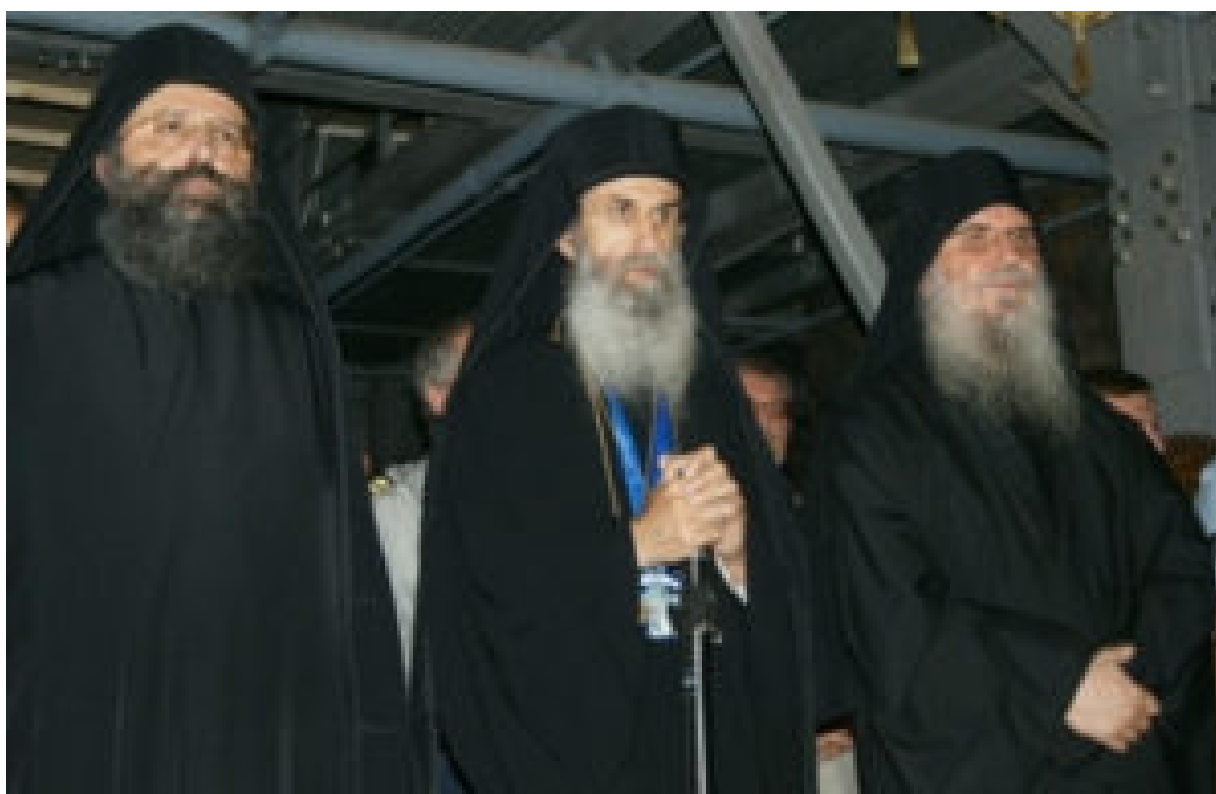
Από την αλλαγή της Ιεράς επιστασίας, την 14η/1η Ιουνίου 2011.