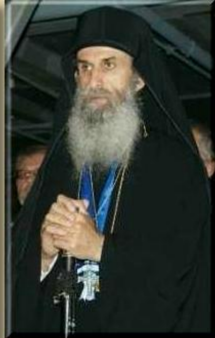
Ο νέος Πρωτεπιστάτης Γέρων Βαρνάβας Βατοπαιδινός