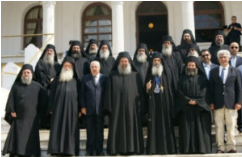
Από την αλλαγή της Ιεράς επιστασίας, την 14η/1η Ιουνίου 2011.