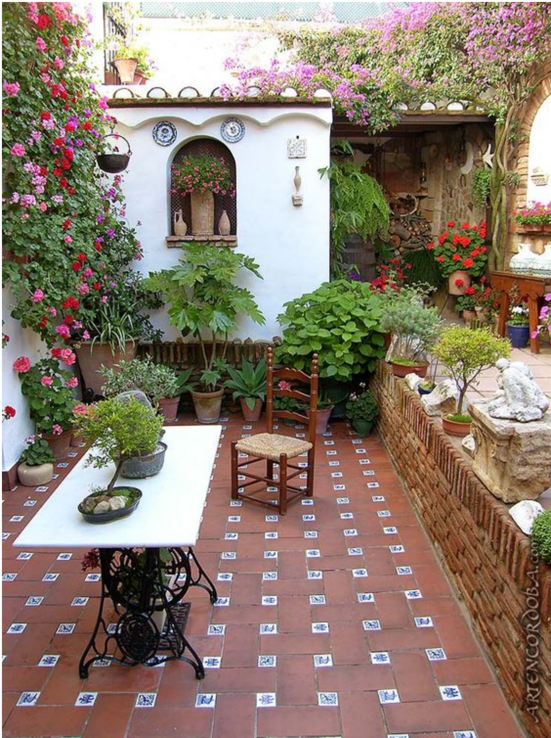
SAMSUNG DIGITAL CAMERA