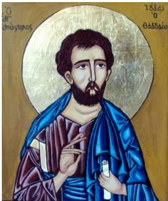
Άγιος Ιούδας ο Απόστολος