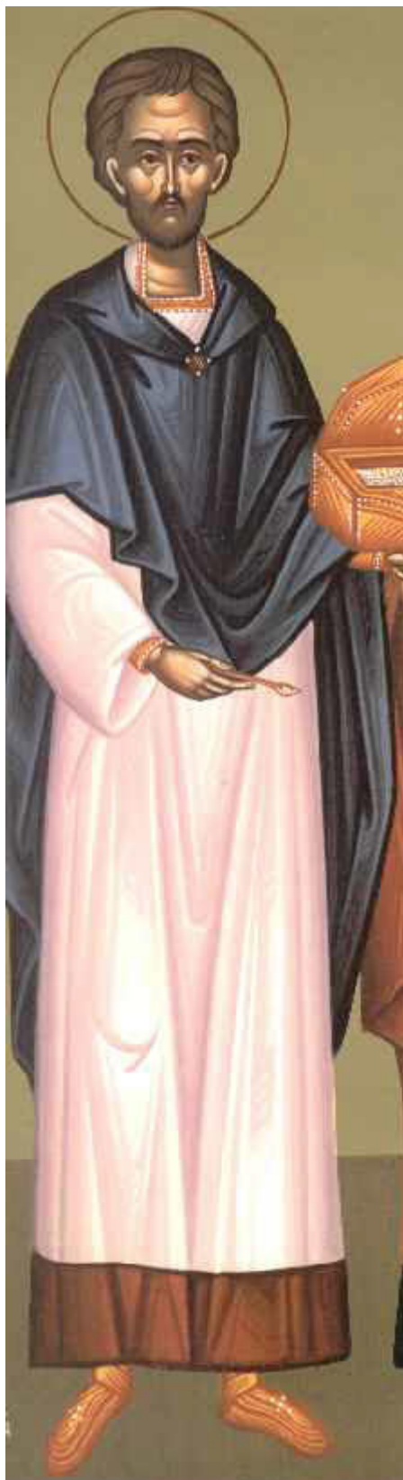
Άγιος Κύρος ο Ανάγκυρος