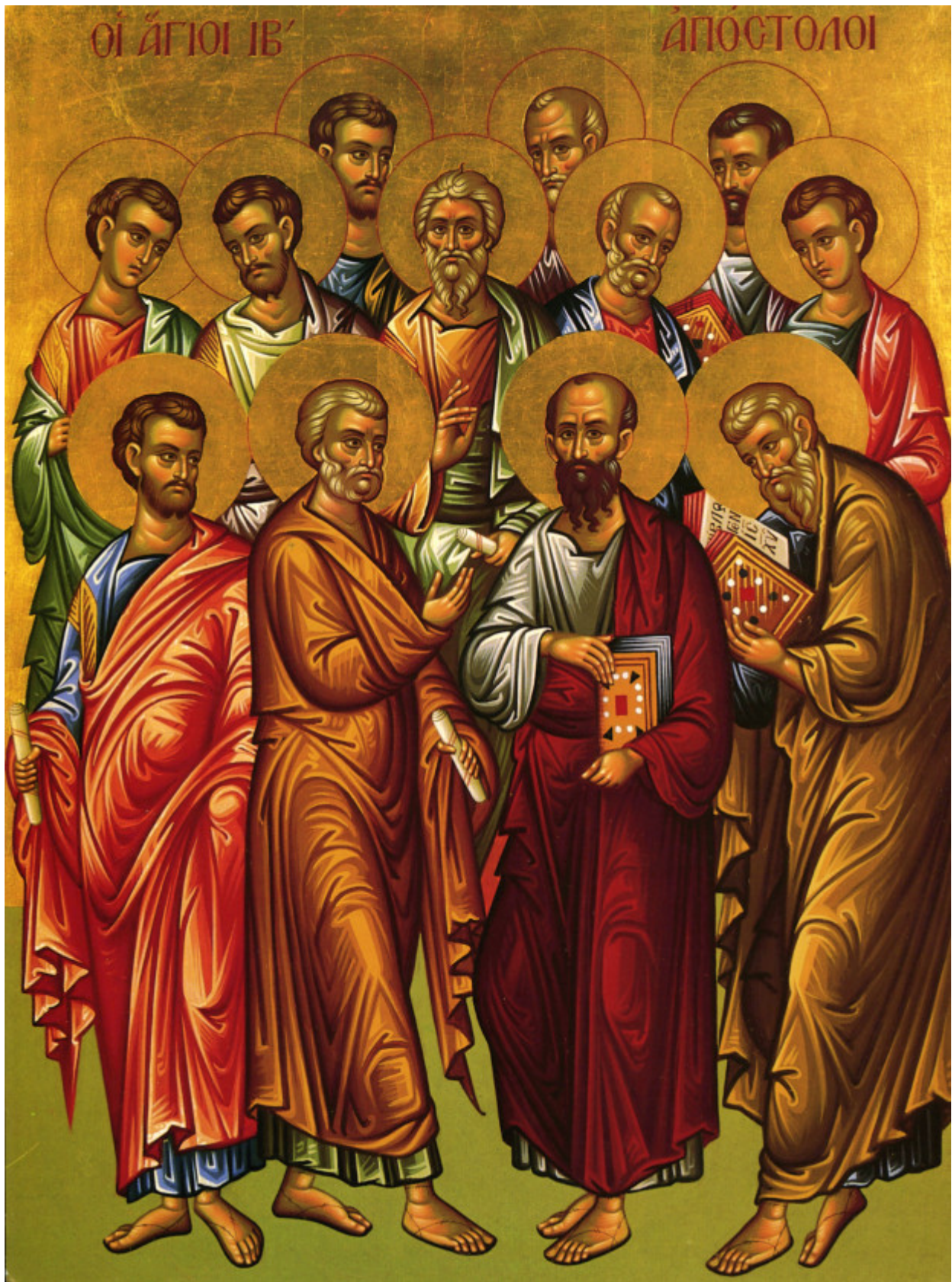
Οι Ἅγιοι Δώδεκα Ἀπόστολοι