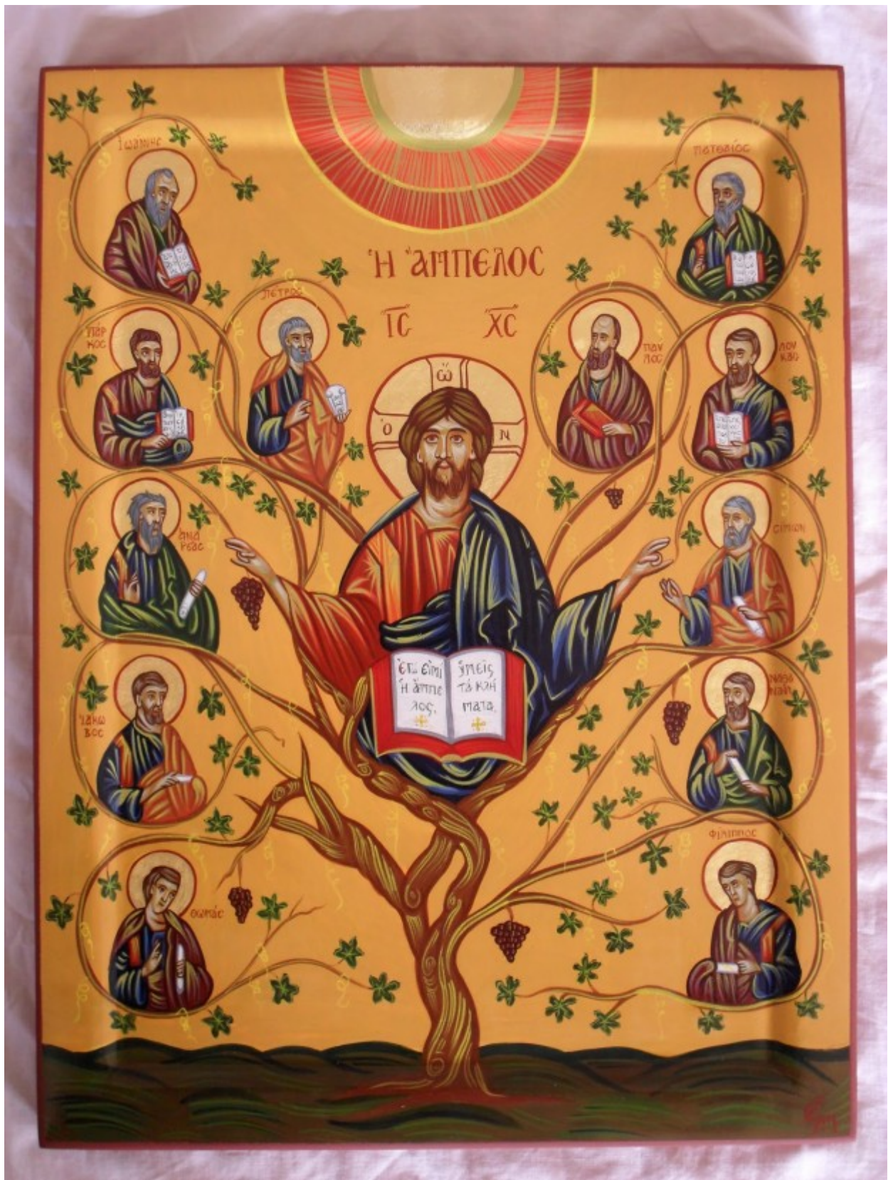
Οι Άγιοι Δώδεκα Απόστολοι - Χρωστήρας© (xrostiras.blogspot.com)