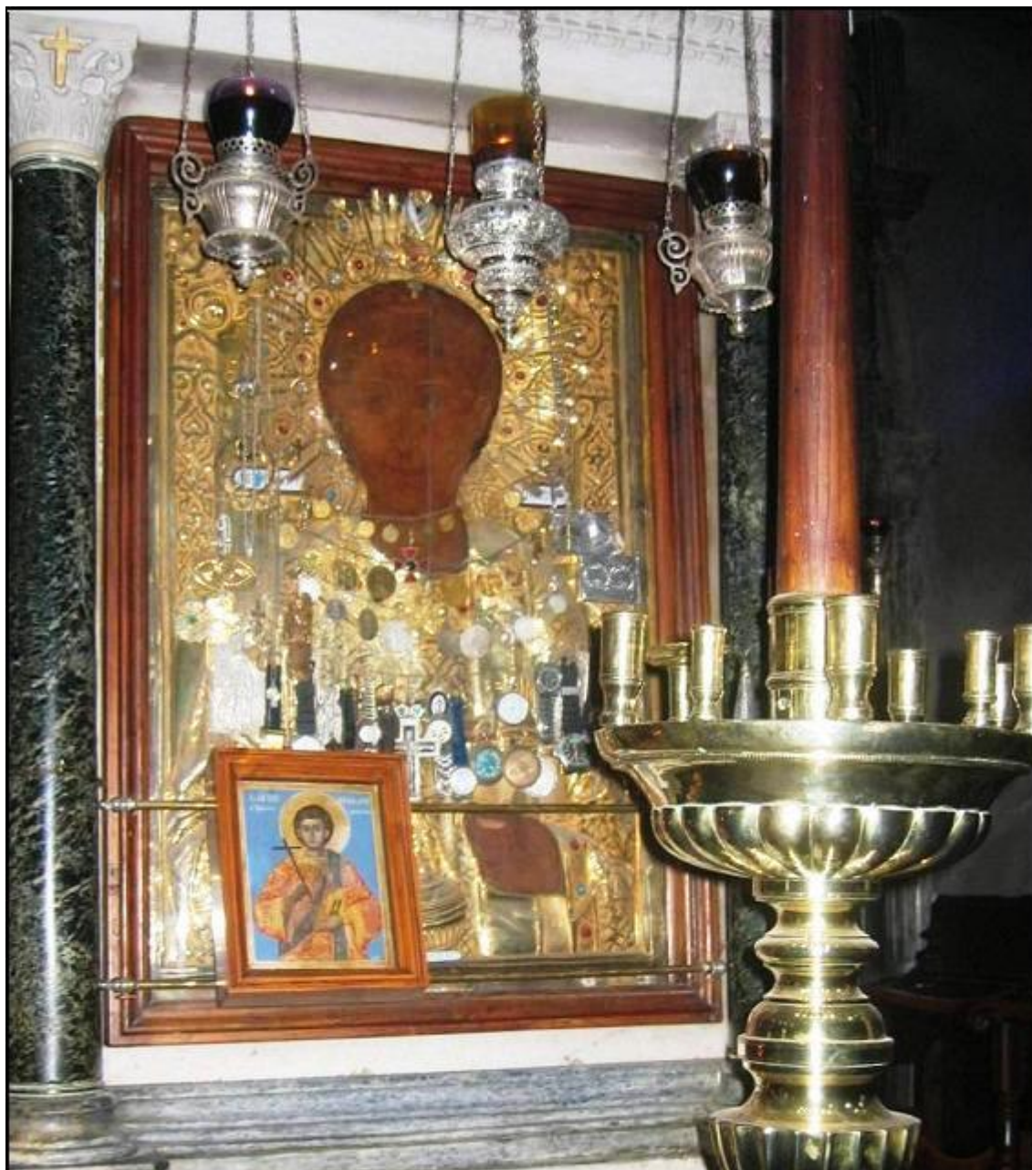
Ιερά Μονή Κωνσταννίτου. Ο Άγιος Στέφανος