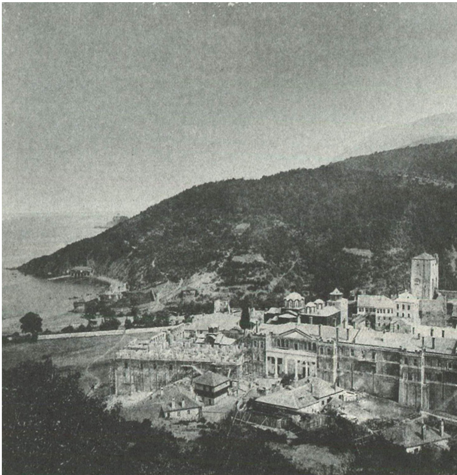
Ιερά Μονή Ιβήρων (φωτ. 1870)