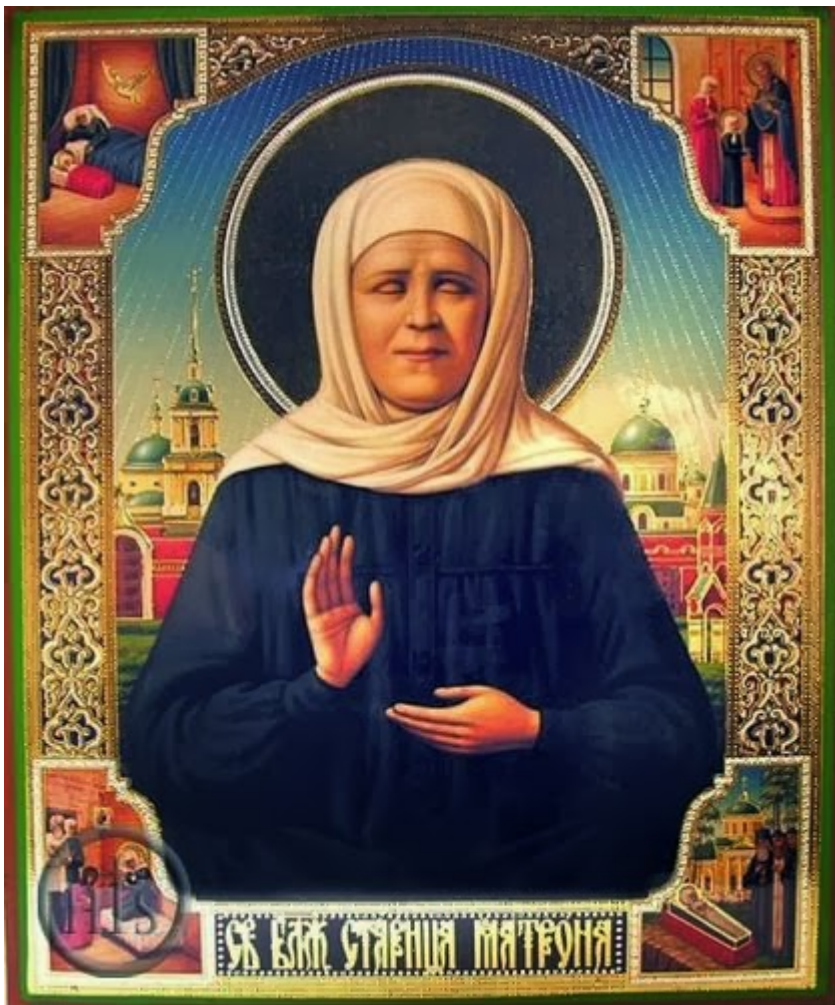
Οσία Ματρώνα εκ Ρωσίας