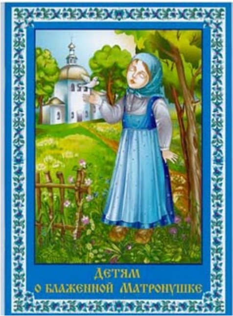
Οσία Ματρώνα εκ Ρωσίας