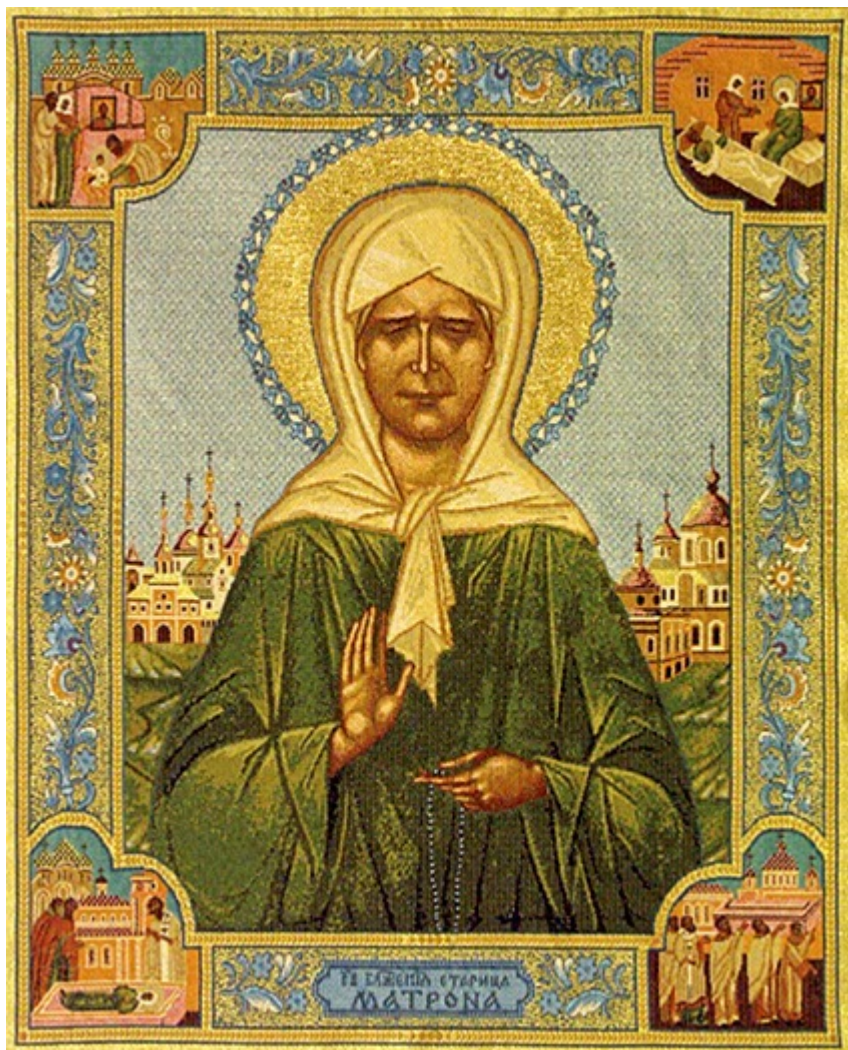
Οσία Ματρώνα εκ Ρωσίας