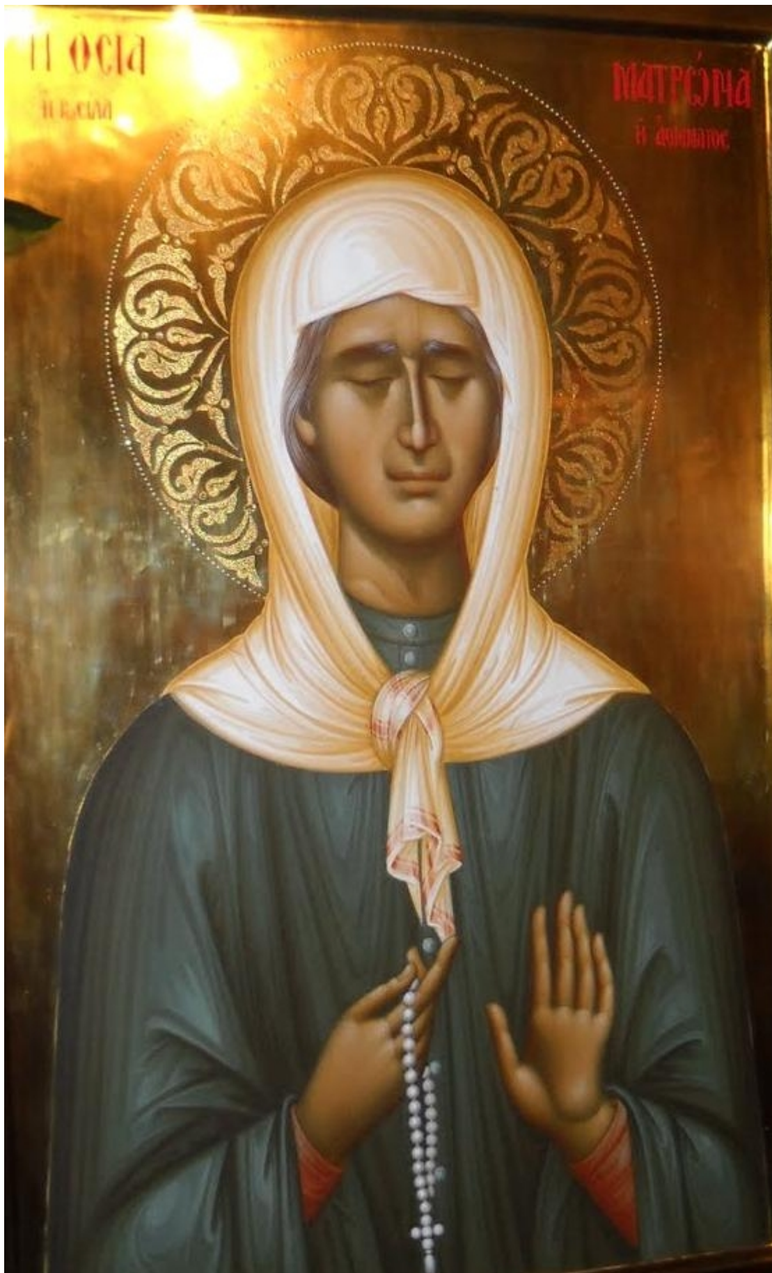
Οσία Ματρώνα εκ Ρωσίας