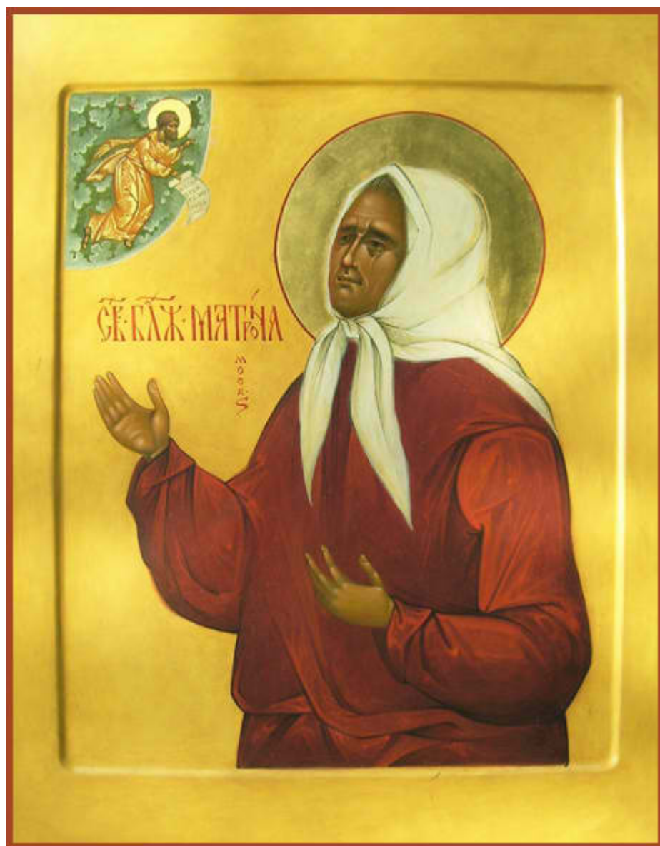
Οσία Ματρῶνα ἐκ Ρωσίας