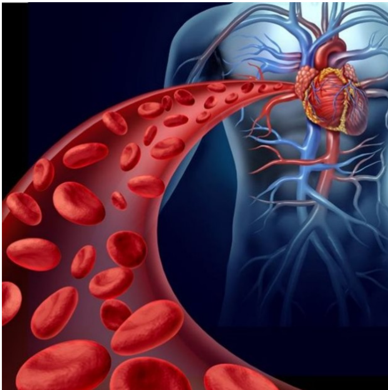
Η κυκλοφορία του αίματος στο ανθρώπινο σώμα αποκαλύπτεται με κάθε λεπτομέρεια από ένα υπερυπολογιστή

Πέτυχε την ρεαλιστική μέχρι σήμερα προσομοίωση του κυκλοφορικού στο ανθρώπινο σώμα