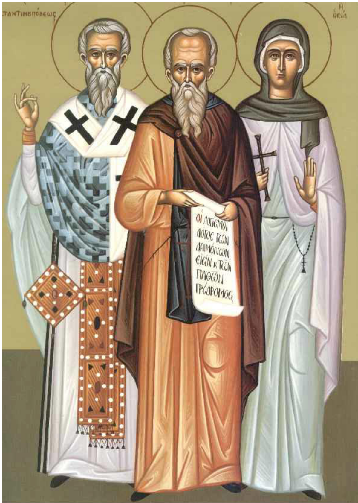
Άγιος Ευτύχιος πατριάρχης Κωνσταντινούπολης-Ο άσιος Γρηγόριος ο Σιναΐτης-Η Οσία ΠΛΑΤΩΝΙΣ